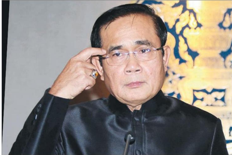
“นายกฯ ลุงตู่” พล.อ.ประยุทธ์ จันทร์โอชา นายกรัฐมนตรี และหัวหน้า คสช. ที่กำลังพิจารณาปรับ “กรม.ประยูทธ์ 4” หลังมีตำแหน่งว่างหลายในหลายกระทรวง

หัวข้อข่าว: ยกเครื่อง'กรม.ประยูทธ์4'ปล่อยข่าว'ลุงป้อม'อยากพักผอน