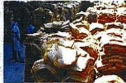
'ฉัตรชัย' สั่งระบายนยาง 3 แสนตัน 6.

หัวข้อข่าว: 'ฉัตรชัย' สั่งระบายนยาง3แสนตัน