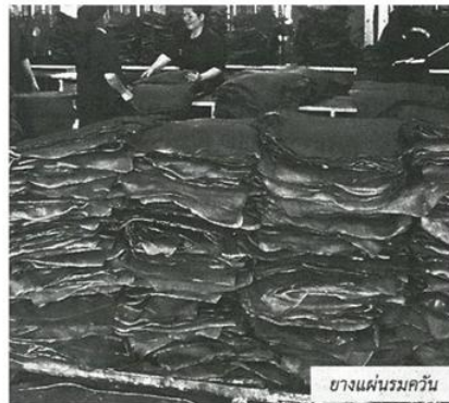
ยางแผ่นรมควัน

จะครบ 2 แสนตัน เป็นยางพาราอัดแท่งเอสทีอาร์ 20 โดยจะส่งลดแรกจำนวน 200 ตันในวันที่ 15 มกราคม 2560 คาดว่ายางลดแรกจะถึงโรงงานบริษัทจินหัวประมาณ