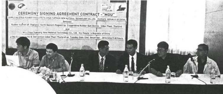
ลงนามสัญญาซื้อขายยางพาราไทย-จีน

หัวข้อข่าว: ไทย-จีน ลงนามซื้อขายยาง 2 แสนตัน สำเร็จอีกก้าวสหกรณ์สวนยางดอนหอย