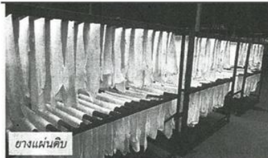
ยางแผ่นดิบ

ในขณะที่เดียวกันปริมาณการใช้ยางโลกโดยเฉลี่ยตั้งแต่ปี 2553-2558 เพิ่มขึ้น 2.48% ในปี 2558 มีปริมาณรวม 12.146 ล้านตัน น้อยกว่าปริมาณการผลิต 0.132 ล้านตันหรือร้อยละ 1.08 ซึ่งจีนยังคงเป็นประเทศผู้ใช้ยางรายใหญ่ สำหรับในปี 2559 ถึงเดือนมิถุนายน ปริมาณการใช้ยางโลกเพิ่มขึ้น 2.7% และจากการคาดการณ์จีดีพี ในปี 2560 คาดว่าจีดีพีโลกจะโตขึ้น 3.34 เพิ่มขึ้นจากปี 2558