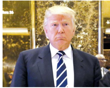
โดนัลด์ ทรัมป์