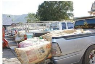
สมาชิกขนมารวมกันเพื่อขาย

ราคาตลาด 4-5 บาท ซึ่งเป็นราคาที่เกษตรกรสมาชิกพึงพอใจ และคาดหวังว่าราคาของพาราจะปรับตัวสูงขึ้นอีก