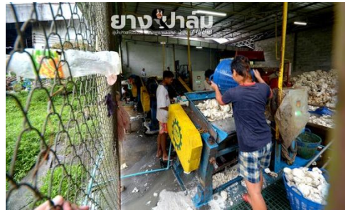
เครื่องจักรรีดยางเครป (FMG)