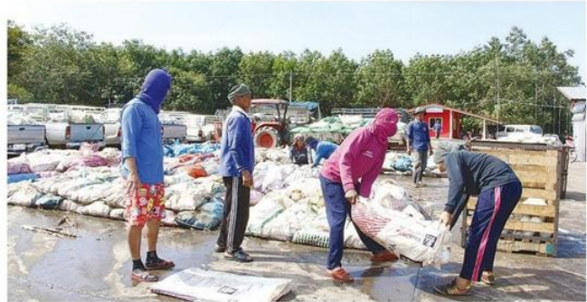
นำผลผลิตมารวมกัน

ประมูลรับซื้อยางในพื้นที่ โดยจำหน่ายราคากิโลกรัมละ 32.59 ซึ่งจะต้องเป็นราคาที่ต่ำกว่าราคา บาท คิดเป็นมูลค่า 3,910,800 บาท สูงกว่า