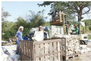
บริหารการขายโดยสหกรณ์

ที่ผ่านมา สำนักงานสหกรณ์จังหวัดพิจิตร ได้นำหลักการสหกรณ์มาใช้เป็นแนวทางในการขับเคลื่อนกลไกตลาดรับซื้อยางพาราในพื้นที่ โดยการเข้าไปแนะนำส่งเสริม