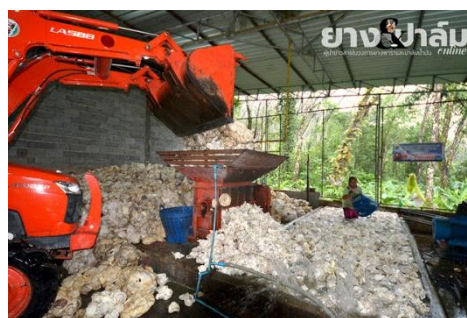
เครื่องสับยางและบดล้าง

แต่ปัญหาของสมาชิกยังไม่ถูกแก้ไข เพราะยางก้อนถ้วยของสมาชิกต้องนำไปขายให้พ่อค้ายางในพื้นที่ ขณะที่สหกรณ์เองก็ไม่มี เงินทุนและประสบการณ์ที่จะรับซื้อยางประเภทนี้ได้เพราะต้องใช้เงินทุนหมุนเวียนหลักแสนต่อวัน