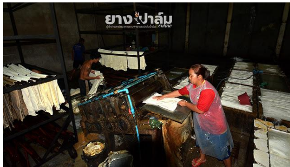
น้ำยางสด

ผู้จัดการสหกรณ์ ฟูฟื้นความเป็นมาของสหกรณ์ฯ ในโตนให้ฟังว่า เริ่มค้นก่อตั้งเมื่อปี 2538 ในยุคที่รัฐบาลมีนโยบายส่งเสริม การแปรรูปน้ำยางสดเป็นยางแผ่นรมควันในภาวะราคายางตกต่ำก่อนจะดำเนินการเรื่อยมาจนถึงปัจจุบัน ซึ่งเป็นสหกรณ์กองทุน สวนยางเพียงไม่กี่แห่งของประเทศ ที่ดำเนินธุรกิจนี้มาอย่างต่อเนื่อง โดยไม่ประสบปัญหาเรื่องการบริหารธุรกิจจึงเป็นหนึ่งใน สหกรณ์กองทุนสวนยางที่มีความเข้มแข็งที่สุดแห่งหนึ่ง สามารถผลิตยางแผ่นรมควัน ได้ปีละกว่า 100 ตัน