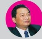
มง เม็ก Chairman Rubber Board of Cambodia