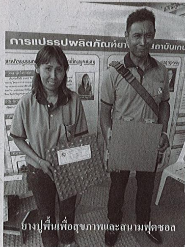
ยางปูพื้นเพื่อสุขภาพและสนามฟุตบอล