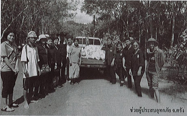
ช่วยผู้ประสบอุทกภัย จ.ตรัง

สร้างความเชื่อมั่นและยอมรับจากตลาดในระดับสากล โดยในปี 2559 ได้นำร่องเปิดโครงการรับรองมาตรฐาน GMP สำหรับยางแผ่นรมควัน ในพื้นที่ จ.ตรัง ปรากฏว่าจาก 30 สหกรณ์ที่สมัครเข้าร่วมโครงการ เบื้องต้นมี 5 สหกรณ์แล้วที่ผ่านการรับรองมาตรฐาน GMP จากทั้งหมดทั่วประเทศมี 176 แห่ง ขณะที่เกษตรกรสมาชิกเองต่างยืนยันว่าพอใจทั้งจากต้นทุนที่ลดลง และราคาขายที่ได้เพิ่ม ไม่ต่ำกว่า 1 บาท/กก. (ไป-กลับคือได้แน่ๆ 2 บาท/กก.) การทำงานก็ง่ายแถมใช้เวลาน้อยกว่าเดิม ซึ่งปัจจุบันสามารถส่งออกขายได้เองอีกด้วย