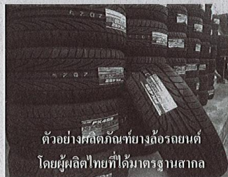
ตัวอย่างผลิตภัณฑ์ยางล้อรถยนต์ โดยผู้ผลิตไทยที่ได้มาตรฐานสากล

กระทรวงเกษตรและสหกรณ์ ได้มีการลงพื้นที่เข้าไปช่วยบรรเทาความเดือดร้อนในเบื้องต้น โดยนำถุงยังชีพและของบริจาคต่างๆ ที่ประชาชนคนไทยได้ร่วมด้วยช่วยกันในครั้งนี้ เพื่อไปมอบให้กับผู้ประสบภัยได้อย่างต่อเนื่องจนครบทั้ง 10 จังหวัด และยังมีแนวทางซึ่งจะตั้งดำเนินการต่อไปในการช่วยเหลือฟื้นฟูหลังน้ำลด กยท. จะเร่งเข้าไปเยียวยาพี่น้องชาวสวนยางเพื่อให้สามารถดำเนินอาชีพต่อไปได้ และโดยเฉพาะอย่างยิ่งปี 2560-2561 จะมีโครงการส่งเสริมสนับสนุนเรื่องการแปรรูปยางพาราเพื่อให้เกิดมูลค่าเพิ่ม และเป็นอาชีพที่มีรายได้เพิ่มมากขึ้นนอกเหนือ