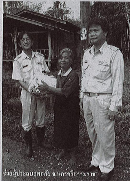
ช่วยผู้ประสบอุทกภัย จ.นครศรีธรรมราช

สร้างความเชื่อมั่นและยอมรับจากตลาดในระดับสากล โดยในปี 2559 ได้นำร่องเปิดโครงการรับรองมาตรฐาน GMP สำหรับยางแผ่นรมควัน ในพื้นที่ จ.ตรัง ปรากฏว่าจาก 30 สหกรณ์ที่สมัครเข้าร่วมโครงการ เบื้องต้นมี 5 สหกรณ์แล้วที่ผ่านการรับรองมาตรฐาน GMP จากทั้งหมดทั่วประเทศมี 176 แห่ง ขณะที่เกษตรกรสมาชิกเองต่างยืนยันว่าพอใจทั้งจากต้นทุนที่ลดลง และราคาขายที่ได้เพิ่ม ไม่ต่ำกว่า 1 บาท/กก. (ไป-กลับคือได้แน่ๆ 2 บาท/กก.) การทำงานก็ง่ายแถมใช้เวลาน้อยกว่าเดิม ซึ่งปัจจุบันสามารถส่งออกขายได้เองอีกด้วย