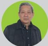
พิบิง จางสมบัติ อดีตรองนายกรัฐมนตรี และประธานสภา วัฒนธรรมไทย - จีนและส่งเสริมความสัมพันธ์