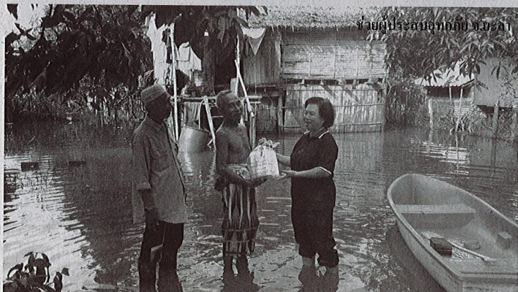
ช่วยผู้ประสบอุทกภัย จ.ยะลา

ในเรื่องนี้ กยท. จะมีการขยายผลต่อไป และครอบคลุมถึงยางวัตถุดิบอีกชนิดอย่าง ยางก้อนถ้วย เพื่อให้เกษตรกรได้รับประโยชน์จากการปรับเปลี่ยนในลักษณะเดียวกันนี้ให้มากที่สุด