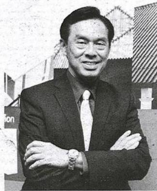
สาธิต สุดบรรทัด

ทั้งนี้ การเติบโตยังมาจากตลาดส่งออกไปยังกลุ่มประเทศ CLMV (กัมพูชา, สปป.ลาว, เมียนมา และเวียดนาม) ที่บริษัทมีแผนเพิ่มยอดขายจากการส่งออกไปยังตลาดดังกล่าวให้มากขึ้น โดยจะทำให้สัดส่วนยอดขายของตลาดส่งออกเพิ่มเป็น 18-19% จากเดิมที่มีสัดส่วนยอดขายอยู่ที่ 17-18% ของ