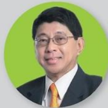
วิชณุ เครืองาม รองนายกรัฐมนตรี

ในพิธีเปิดงานวันยางพาราและกาชาดบึงกาฬ 2560 “บึงกาฬ ศูนย์กลางยางพารา การท่องเที่ยวก้าวหน้า การค้าก้าวไกล” 16 กุมภาพันธ์ 2560