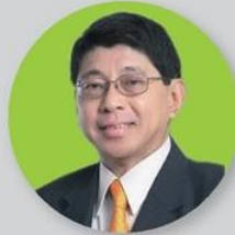
วิชชุ เครืองาม รองนายกรัฐมนตรี

ในพิธีเปิดงานวันยางพาราและกาชาดบึงกาฬ 2560 “บึงกาฬ ศูนย์กลางยางพารา การท่องเที่ยวก้าวหน้า การค้าก้าวไกล” 16 กุมภาพันธ์ 2560