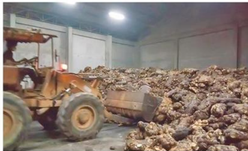
พื้นที่เก็บยางพารา

ขอให้ติดตามข้อมูลข่าวสารการตลาดอยู่เสมอ เพื่อการตัดสินใจในธุรกิจได้ถูกต้อง เหมาะสม ทันสถานการณ์ ไม่ควรคาดหวังกำไรเกินควร โดยซื้อเก็บเพื่อรอราคา เพราะอาจเกิดความเสียหายหรือสร้างความเสียหายต่อสหกรณ์ฯ ได้ สหกรณ์ฯ ควรใช้วิธีการแบบซื้อมา-ขายไป