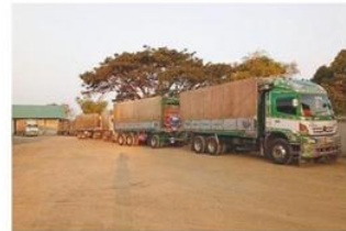
รถขนส่งยางพารา

จังหวัดศรีสะเกษเป็นจังหวัดหนึ่งในภาคตะวันออกเฉียงเหนือที่มีพื้นที่ปลูกยางพาราเป็นอันดับ 4 ของจำนวนพื้นที่ปลูกทั้งหมดในภาคตะวันออกเฉียงเหนือ รองจากจังหวัดหนองคาย จังหวัดเลย และจังหวัดอุดรธานี โดยที่มีพื้นที่ปลูกยางพาราจำนวน 202,670 ไร่ ของพื้นที่ปลูก