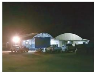
ค้ำมีดที่ยังทำงาน