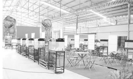
ศูนย์การเรียนรู้พืช วิลเลจ จ.ราชบุรี

พิพิธภัณฑ์เป็นแหล่งเรียนรู้ที่รวบรวมข้อมูล ความเข้ามา เรื่องราวประวัติศาสตร์ต่างๆ ที่มีความสำคัญต่อการเรียนรู้ของคนในสังคมให้ได้สำนึกในการรู้จักตนเอง รู้จักเพื่อนบ้าน และรู้จักโลก ล่าสุด ทางมิวเซียมสยามได้จัดพิธีลงนามบันทึกข้อตกลงความร่วมมือการพัฒนาเครือข่ายพิพิธภัณฑ์การเรียนรู้ ร่วมกับหน่วยงานอีก 4 แห่ง คือ 1.“พิพิธภัณฑ์ปัญญานันทภิกขุ จ.นนทบุรี” ซึ่งเป็นพิพิธภัณฑ์เชิงศาสนาและวัฒนธรรม 2.“พิพิธภัณฑ์บ้านดงโฮจิมินห์ จ.พิจิตร” เพื่อเป็นศูนย์การเรียนรู้เชิงประวัติศาสตร์ 3.“ศูนย์การเรียนรู้ การยางแห่งประเทศไทย กรุงเทพฯ” เป็นพิพิธภัณฑ์เชิงวัฒนธรรมและธุรกิจ และ 4.“ศูนย์การเรียนรู้พืช วิลเลจ จ.ราชบุรี” เป็นศูนย์การเรียนรู้เชิงนิเวศ