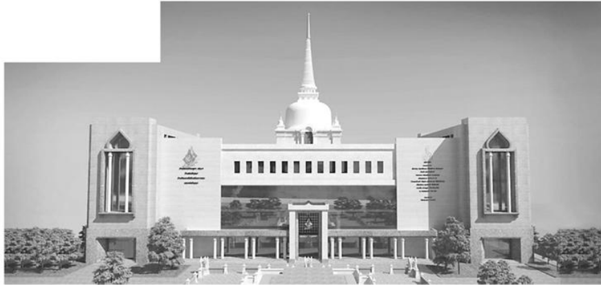
พิพิธภัณฑ์ปัญญานันทภิกขุ จ.หนองบัวลำภู

รองรับนักท่องเที่ยวชาวเวียดนามและอาเซียนได้อย่างภาคภูมิใจ