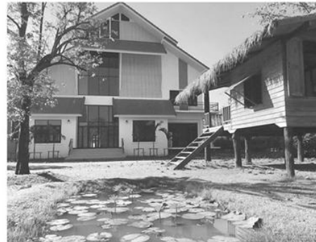
อาคารพิพิธภัณฑ์เชิงศาสนาและวัฒนธรรม “พิพิธภัณฑ์บ้านดงโฮจิมินห์ จ.พิจิตร