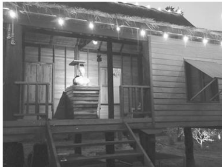
พิพิธภัณฑ์เชิงศาสนาและวัฒนธรรม “พิพิธภัณฑ์บ้านดงโฮจิมินห์ จ.พิจิตร

วิญญู เอม ประณีตร ผู้ดำเนินงานพิพิธภัณฑ์ปัญญานันทภิกขุ กล่าวว่า โครงการจัดตั้งพิพิธภัณฑ์ปัญญานันทภิกขุถือเป็นอีกหนึ่งโครงการที่สำคัญและยิ่งใหญ่มาก ถือว่าพิพิธภัณฑ์แห่งนี้เป็นแหล่งเรียนรู้ใหม่ที่