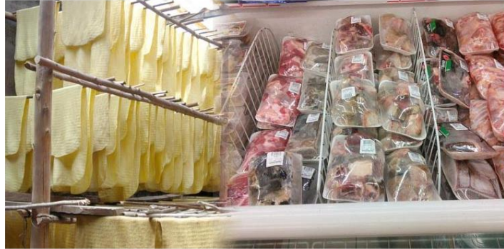
เปิด 6 หุ้นตัวเต็ง เตรียมแดงรับผลดีหลังตัวเลขส่งออกพุ่ง

หัวข้อข่าว: เปิด 6 หุ้นตัวเต็ง เตรียมแดงรับผลดีหลังตัวเลขส่งออกพุ่ง