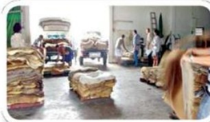
เป็นตัวแทนสร้างมูลค่าให้ยางพาราช่วงราคาตกต่ำ