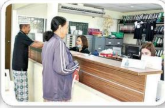
ให้บริการสมาชิก