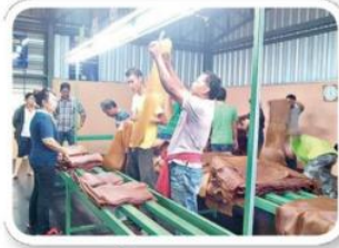
รวมซื้อรวมขายยางพารา