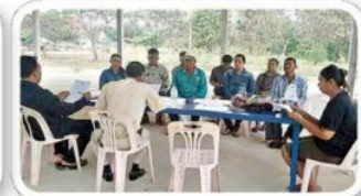
บริหารจัดการแบบรวมกลุ่ม

โคนมพิมาย จำกัด อำเภอพิมาย จังหวัดนครราชสีมา มีเกษตรกรรวม 6,300 ราย เป็นประธานกรรมการ ปัจจุบันมีสมาชิกจำนวน 183 คน ได้รับรางวัลจากโครงการพัฒนาธุรกิจโคนมสู่ประชาคมเศรษฐกิจอาเซียน โครงการฝึกอบรมผสมเทียมสำหรับสมาชิกและผู้เกี่ยวข้อง และโครงการผลิตอาหารผสมครบถ้วน