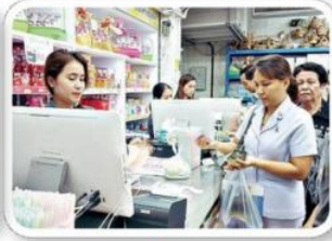
สหกรณ์โรงพยาบาล