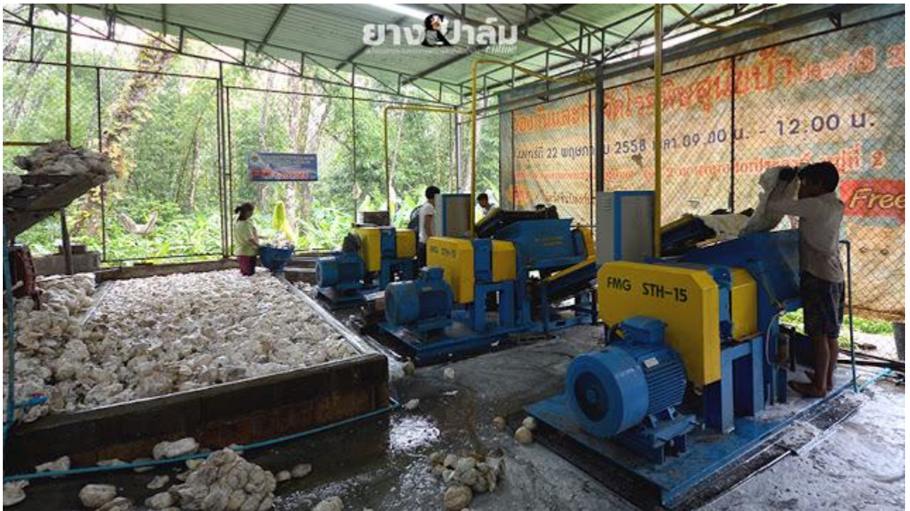
โรงงานผลิตยางเครปของ สหกรณ์กองทุนสวนยางใน โตน จ.พังงา เป็นหนึ่งในตัวอย่างของสถาบันเกษตรกร ที่ลงทุนผลิตยางเครป แก้ปัญหาการซื้อขายยางก้อนด้วยที่ไม่เป็นธรรม

ก่อนหน้านั้นผู้ประกอบการรายใหญ่หัวใสแจกเครื่องทำยางเครปให้สถาบันเกษตรกรแล้วรับซื้อก้อนด้วยมาทำเครป แต่ต้องล้มเลิกไปเพราะยางเครปคือเนื้อยางแห้งเกือบ 100% ไม่สามารถคคค่า DRC จากเกษตรกรได้ก็ล้มเลิกโครงการดีไป อีก