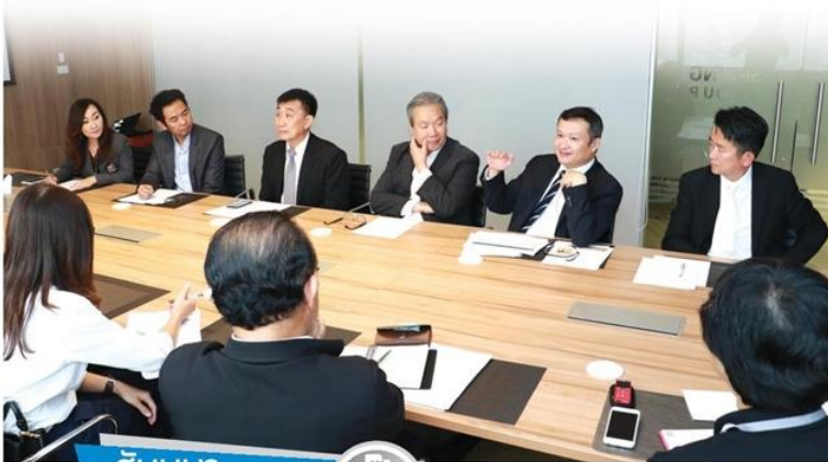
สัมมนา โต๊ะกลม

ผู้ประกอบการอสังหาฯทั้งส่วนกลาง-ท้องถิ่น ประสานเสียงตลาดภาคใต้มีแนวโน้มเติบโต หลังภาครัฐ เดินหน้าโครงการเมกะโปรเจกต์ตามแผน โดยเฉพาะ หัวหิน ภูเก็ต หาดใหญ่ และสุราษฎร์ธานี ด้าน AREA ชี้หน่วยเหลือขายในตลาดหลักเมืองท่องเที่ยวจะดูดซับหมดภายใน 2 ปี