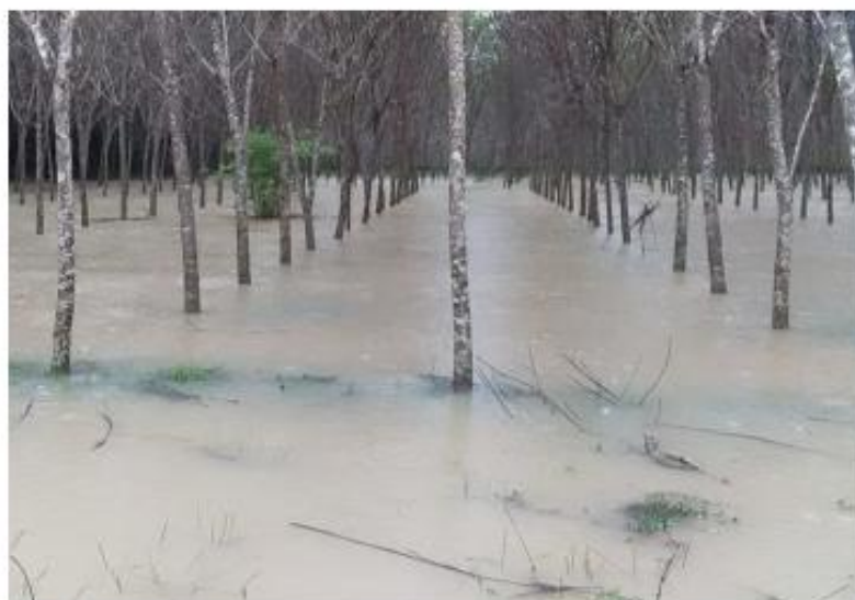
ภาพนิภาพ

ภาคใต้ยางทยายจากตลาดครึ่ง เหลือราวกว่า 2 ล้านตัน ภาคใต้กรีดยางเฉลี่ยได้เดือนละ 10 วัน จาก 20 วัน ปัจจุบันฝนตกต่อเนื่องจากนี้ที่แล้ว ชีขาวสวนยาง อีสาน เหนือ แสบบี