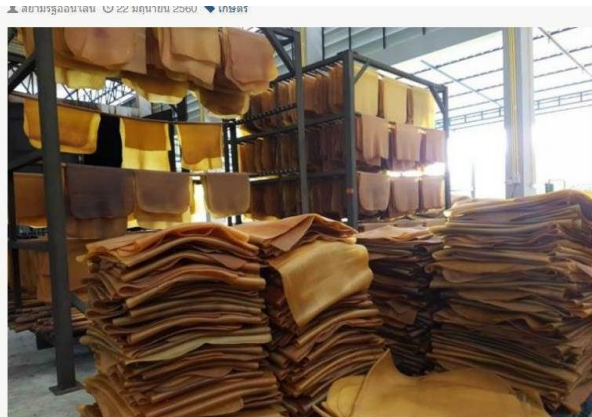
การยางแห่งประเทศไทย เดินหน้าพัฒนาโรงงานแปรรูปยาง พร้อมส่งเสริมแปรรูปยาง เพิ่มมูลค่า เบื้องต้นชุมชนสหกรณ์จังหวัดระยอง จำกัด ยกระดับสู่มาตรฐาน GMP