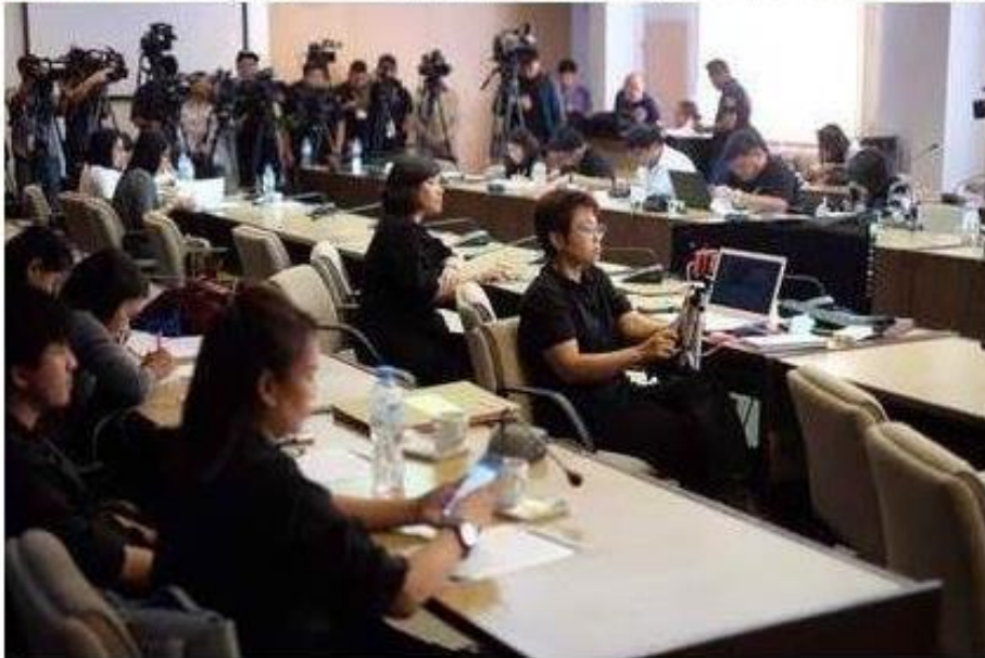
รูปทั้งหมด

ข่าวทั่วไป ThaiPR.net -- รหัสสดที่ 13 กรกฎาคม 2560 11:47:39 u.