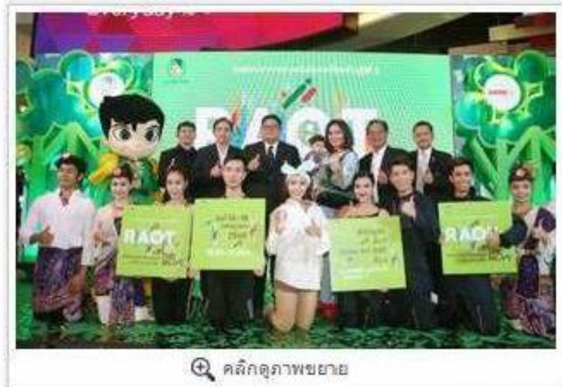
คลิกดูภาพขยาย

การยางแห่งประเทศไทย (กยท.) แลงข่าวการจัดงาน "RAOT on The Move : นวัตกรรมการแปรรูปจุดเปลี่ยนยางพาราไทย" ณ ศูนย์การค้าไอซ์ ดีซี พระราม 9 เนื่องในโอกาสครบรอบวันสถาปนาการยางแห่งประเทศไทยก้าวสู่ปีที่ 3 ชูแนวคิดส่งเสริม นวัตกรรมยางสู่มิติการแปรรูปผลิตภัณฑ์ เพิ่มมูลค่ายางพาราไทย ขับเคลื่อนการพัฒนาทางในยุคไทยแลนด์ 4.0