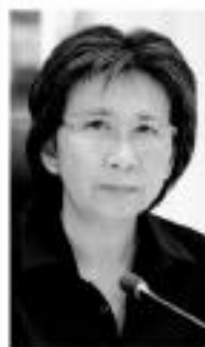
ดวงพร รอดหยาด

● กันร้อนที่สุดเห็นจะไม่พ้นดวงพร รอดหยาด อธิบดีกรมการค้าต่างประเทศ ในฐานะคณะทำงานระบายข้าวในสต็อกรัฐ เพราะปฏิเสธขายข้าวให้เซเชลส์ ตั้งกรมรอฟังคำชี้แจง