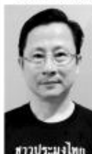
ชาวประมงไทย