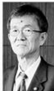
วิธิตงสมิตร

วิจิตรวาทการ กมธ. ในสัดส่วนพรรค. ยืนยันไม่เออียูและ