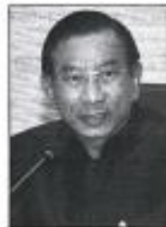
พล.อ.ฉัตรชัย สวัสดิ์ยะ

2.การจัดตั้งตลาดยางพาราระดับภูมิภาค (ITRC Regional Rubber