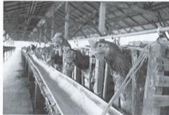
เลี้ยงไก่พันธุ์ไข่ไว้ประมาณ 20,000 ตัว

พื้นที่จังหวัดเชียงใหม่ ซึ่งเป็นพื้นที่ปลูกยางใหม่โดยอยู่ในความดูแลของการยางแห่งประเทศไทย จ.เชียงใหม่ ครอบคลุมพื้นที่ 4 จังหวัด ได้แก่ เชียงใหม่ ลำพูน ลำปาง และแม่ฮ่องสอน ซึ่งมีเกษตรกรชาวสวนยางขึ้นทะเบียนกับ กยท. ประมาณ 2,067 ราย คิดเป็นพื้นที่ปลูกยางประมาณ 20,610 ไร่ ส่วนใหญ่เป็นเกษตรกรชาวสวนยางรายย่อย ประกอบอาชีพอื่นๆ ควบคู่กับการทำสวนยางพารา ทำให้สิ่งที่ยังการยางแห่งประเทศไทยให้ความสำคัญ นอกเหนือจากการส่งเสริมเกษตรกรชาวสวนยางในด้านการปลูกสร้างและการดูแลสวนยางแล้ว การยกระดับความเข้มแข็งของเกษตรกรด้วยการส่งเสริมการรวมกลุ่มเป็นสถาบันเกษตรกรชาวสวนยาง ยังเป็นเรื่องที่ต้องเร่งผลักดันและส่งเสริมอย่างยิ่ง เพราะลักษณะภูมิประเทศของภาคเหนือ แม้จะได้เปรียบด้านยุทธศาสตร์การส่งออกไปยังประเทศเพื่อนบ้าน โดยเฉพาะประเทศจีน แต่ด้วยปริมาณผลผลิต และการลงทุนภาคเอกชนในการแปรรูป ตลอดจนภูมิประเทศที่เป็นภูเขาสลับซับซ้อน ทำให้การขนส่งค่อนข้างลำบาก ฉะนั้น การจัดตั้งตลาดยางพาราระดับท้องถิ่น เพื่อเป็นจุดรวบรวมและจำหน่ายผลผลิต เพื่อเป็นการสร้างอำนาจการต่อรอง จะเป็นประโยชน์สูงสุดต่อเกษตรกรชาวสวนยาง ปัจจุบันมีสถาบันเกษตรกรชาวสวนยางที่ขึ้นทะเบียนกับ กยท.จ.เชียงใหม่ โดยแบ่งเป็นนิติบุคคล 10 กลุ่ม และสถาบันเกษตรกรและเครือข่ายชาวสวนยาง 79 กลุ่ม และที่สำคัญ