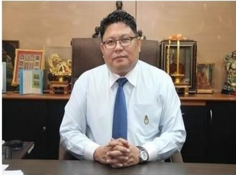
ครูปทั้งหมด

ข่าวทั่วไป ThaiPR.net -- จันทร์ที่ 25 ธันวาคม 2560 16:57:16 น.