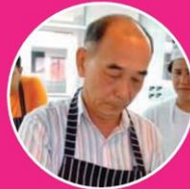
จกใต้ดียว เชฟชื่อดังระดับโลก ช่างเย็บอาหาร