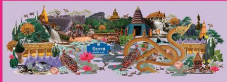
ภาพคอลลาจ "บึงกาฬ"