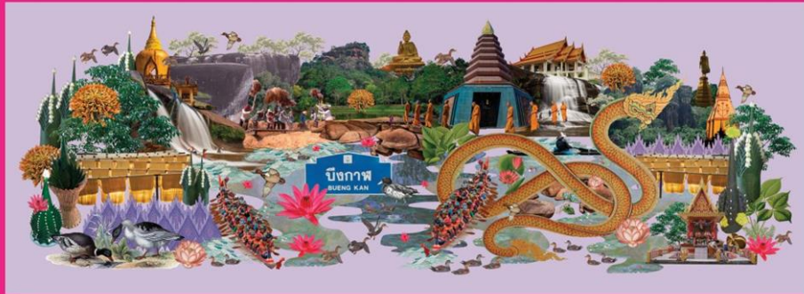
ภาพคอลลาจ “บึงกาฬ”