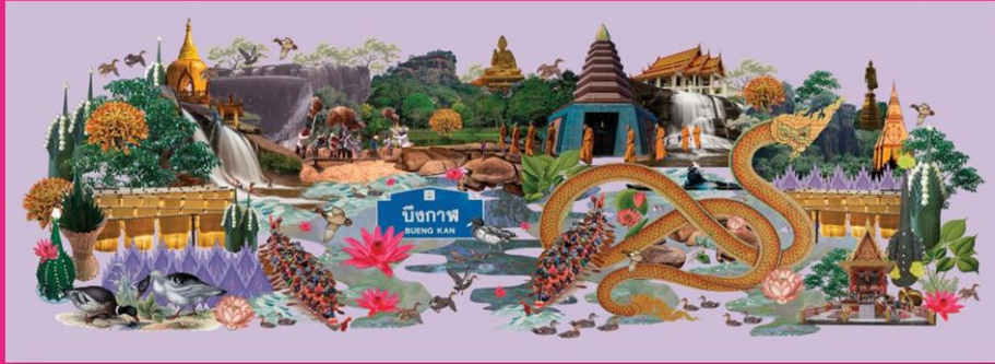
ภาพคอลลาจ “บึงกาฬ”