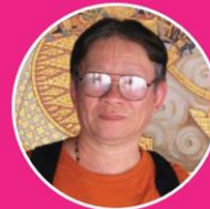
สมบัติ คิ้วอก นักวาดการ์ตูนชื่อดัง