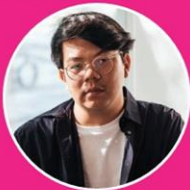
นักรบ มูลมานีส ศิลปินคอลลาจร่วมสมัยระดับประเทศ