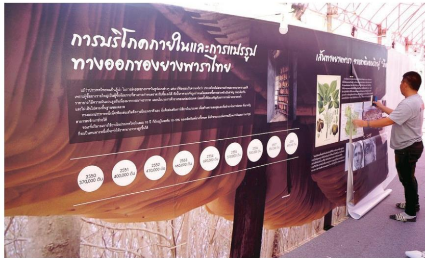
งานยางบึงกาฬ - เจ้าหน้าที่เร่งเตรียมความพร้อมการจัดงานวันยางพาราและงานกาชาดจังหวัดบึงกาฬ เทศกาลงานสำคัญของชาวจังหวัดบึงกาฬ มีการแสดงนวัตกรรมการผลิตยางและกิจกรรมความบันเทิงต่างๆ มากมาย ระหว่างวันที่ 17-23 มกราคม ณ สนามหน้าที่ว่าการอำเภอเมือง จ.บึงกาฬ เมื่อวันที่ 14 มกราคม