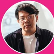
นักรบ มูลมานัส