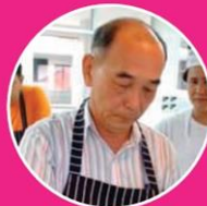
จกใต้เคียว

อ.ประจำหลักสูตรอุตสาหกรรม อาหารและการบริการ และผู้เชี่ยวชาญด้านอาหาร ศูนย์ปฏิบัติการอาหารนานาชาติ ม.ราชภัฏสวนดุสิต