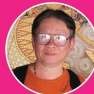
สมบัติ คิ้วอก