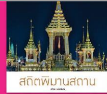
สถิตพิฆานสถาน