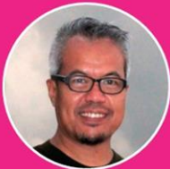
สละ นาคบำรุง ศิลปินผู้วาดพระนพชาชนกฉบับการ์ตูน