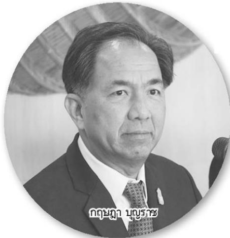
กฤษฎา บุญราช

กระทรวงเกษตรฯ สัญจรกลุ่มอีสานตอนบน วานนี้ (29 ม.ค.) เวลา 09.00 น. แจงนโยบายปฏิรูปภาคการเกษตร เร่งขึ้นนอตกลไกที่มบริหารแก้ปัญหาภาคเกษตรในพื้นที่ พร้อมตั้งรองปลัดฯ-อธิบดี-ผู้ตรวจกระทรวงฯ เป็นโค้ชรายจังหวัดเพิ่มทางเลือกเกษตรกรทำการเกษตรที่มีรายได้ดีกว่า โดย “กฤษฎา บุญราช” รัฐมนตรีว่าการกระทรวงเกษตรและสหกรณ์ “วิวัฒน์ ศัลยกำธร” รัฐมนตรีช่วยว่าการกระทรวงเกษตรและสหกรณ์ พร้อมด้วยผู้บริหารกระทรวงเกษตรและสหกรณ์ ลงพื้นที่ร่วมประชุมสัมมนา “การขับเคลื่อนนโยบายกระทรวงเกษตรและสหกรณ์ในระดับพื้นที่สู่การปฏิบัติ” ครั้งที่ 2 ภาคตะวันออกเฉียงเหนือตอนบน ณ วิทยาลัยการปกครองท้องถิ่น มหาวิทยาลัยขอนแก่น จ.ขอนแก่น เพื่อชี้แจงนโยบายการดำเนินงานของกระทรวงเกษตรและสหกรณ์แก่ผู้ปฏิบัติงานในระดับพื้นที่ และเพื่อให้ผู้ปฏิบัติงานในพื้นที่บูรณาการการทำงานร่วมกับภาคส่วนต่างๆ รวมทั้งหารือร่วมกับภาคเอกชนในพื้นที่ในการจัดหาแนวทางช่วยเหลือเกษตรกร การประชุมสัมมนาครั้งนี้มีผู้เข้าร่วม