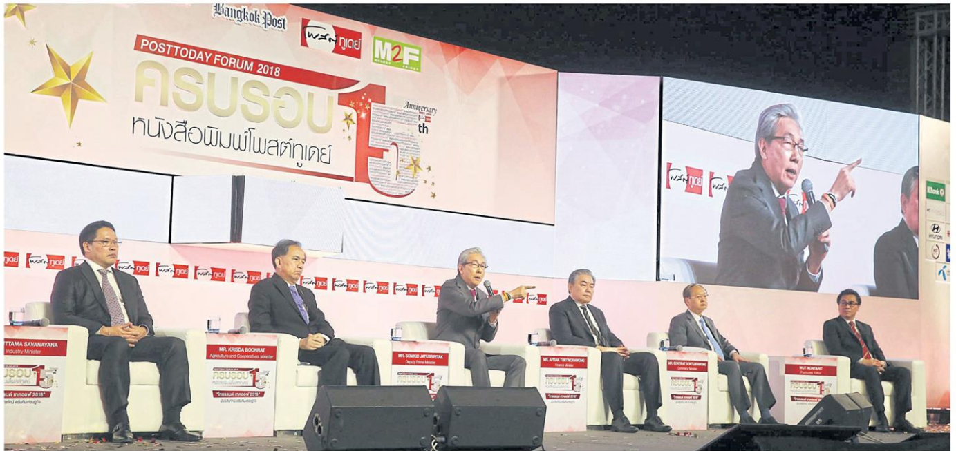
Deputy Prime Minister Somkid Jatusripitak (with microphone) and key economic ministers joined yesterday's 'Thailand Takeoff 2018' seminar organised by 'Post Today' newspaper. WEERAWONG WONGPREEDEE