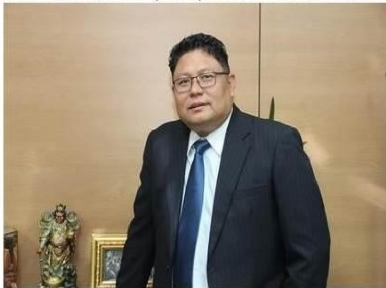
ครบทั้งหมด

ข่าวทั่วไป ThaiPR.net -- พุธที่ 7 กุมภาพันธ์ 2561 15:57:06 น.