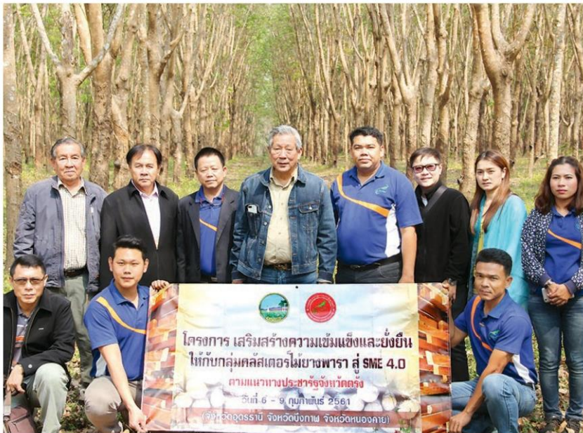
ชมสวนยาง - นายพินิจ จารุสมบัติ อธิบดีรองนายกรัฐมนตรี และประธานสภาวัฒนธรรม ไทย-จีนและส่งเสริมความสัมพันธ์ นำกลุ่มคลัสเตอร์ไม้ยางพารา จ.ตรัง เข้าชมสวนยางพารา ของตนเองที่บ้านโนนไพศาล ต.โคกกว้าง อ.นุ่งคล้า จ.บึงกาฬ เมื่อวันที่ 7 กุมภาพันธ์

นายศิริพัฒน์กล่าวว่า มาพบปะศึกษาดูงาน เพื่อพัฒนาขยายธุรกิจแปรรูปไม้ยางพารา และเจรจาการค้ากันเกี่ยวกับไม้ยางพารา เพราะทราบว่าทางภาคอีสานเริ่มมีการโค่นไม้ ยางพาราที่หมดอายุการกรีดยางแล้ว เราชาวตรัง มีประสบการณ์ในการทำไม้ยางพารา เรามี การตลาดคู่ค้า ไม่ว่าจะจีน สหรัฐ ประเทศ ในกลุ่มสแกนดิเนเวียและยุโรป ในฐานะที่เรา เป็นคนไทยและทำเรื่องยางพาราด้วยกัน ไม่ ยากเกินไปเปิดท่อใหม่หรือตลาดใหม่ๆ ซึ่งไม่รู้