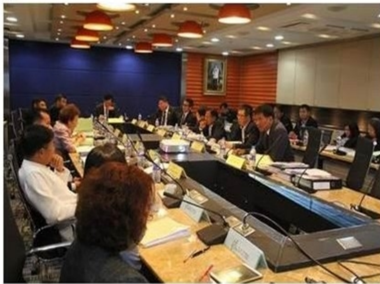
สรุปทั้งหมด