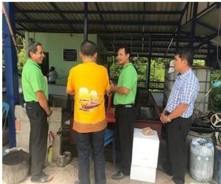
ครูปั้งหมด

ข่าวทั่วไป ThaiPR.net -- จันทร์ที่ 19 มีนาคม 2561 14:59:11 น.