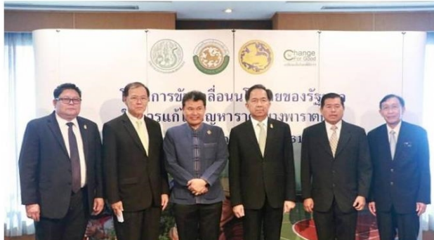
ก.เกษตรกระตุ้นท้องถิ่นใช้ยางพาราเพิ่ม พร้อมชงพาณิชย์ตั้งกรมการคুমราคา

กระทรวงเกษตรฯ รุกหาคำตอบเข้า อปท. เพิ่มปริมาณการใช้ยางตามนโยบายรัฐบาล พร้อมเตรียมชงพาณิชย์ตั้งกรมการคูดยาง หวังกำหนดราคารับซื้อ ชวย ป้องกันค่าเกินทุน พร้อมหารือประเทศกลุ่มผู้ผลิตยางรายใหญ่หามาตรการเสริมเชิงราคา