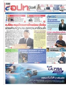
ฉบับที่ 279 ปักแทรก วันที่ 1-15 มีนาคม พ.ศ.2561

โดยขอให้องค์กรปกครองส่วนท้องถิ่นจัดทำโครงการก่อสร้างปรับปรุงถนนที่มีส่วนผสมของยางพารา หรือสิ่งก่อสร้างอื่นๆ ที่ใช้ยางพาราเป็นวัสดุหลักอย่างน้อย 1 โครงการ เพื่อให้การแก้ไขปัญหาราคายางพาราตกต่ำเป็นไปตามนโยบายของรัฐบาล ในการช่วยเหลือเกษตรกรผู้ปลูกยางรายย่อย และจากการสรุปผลการรายงานขององค์กรปกครองส่วนท้องถิ่นทั่วประเทศ ได้รายงานว่ามีโครงการงบประมาณเงินสะสมแล้ว 5,473 ล้านบาท ใช้ยางพาราประมาณ 3,940 ตัน และทางองค์การบริหารส่วนจังหวัด ก็ได้รายงานว่ามีโครงการงบประมาณเงินสะสมแล้ว 44 จังหวัด คิดเป็น 1,872 ล้านบาท ใช้ยางพาราไป 1,173 ตัน มีองค์การบริหารส่วนจังหวัด ขออนุมัติงบประมาณการปรับแบบ 15 จังหวัด และมีองค์การบริหารส่วนจังหวัด รายงานว่าไม่มีโครงการที่ใช้ยางพารา 16 จังหวัด