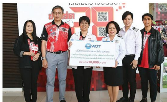
'การทำอากาศยานฯ' จัดเต็มความสุข