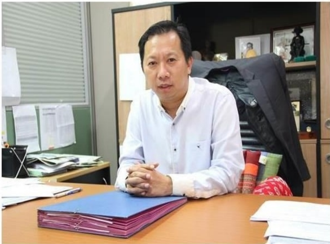
กรุงเทพฯ--10 เม.ย.--การยางแห่งประเทศไทย