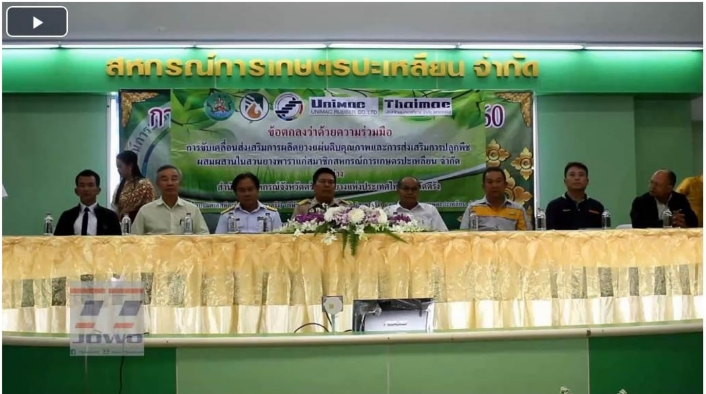
สกกปะเหลียน เษ ทำMOUพัฒนาคุณภาพยางส่งเสริมการปลูกพืชผสมผสาน

หัวข้อข่าว: สมาชิกสหกรณ์การเกษตรประเหลียน เษ ทำMOU พัฒนาคุณภาพยางส่งเสริมการปลูกพืชผสมผสาน