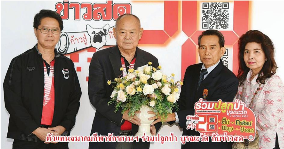
ตัวแทนสมาคมกีฬาจักรยานฯ ร่วมปลูกป่า บูรณะวัด กับข่าวสด

หัวข้อข่าว: 'ออลเจ้'ร่วม'ข่าวสด'ช่อมวัตสมทบทุนในโอกาสก้าวสู่ปี28ทุกวงการร่วมยินดี