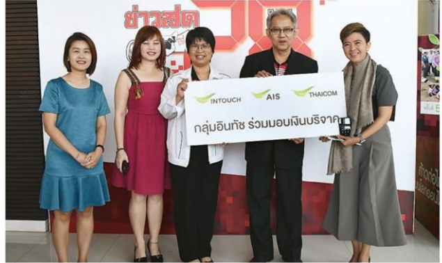
กลุ่มอินทัชร่วมทำบุญวันเกิดข่าวสด