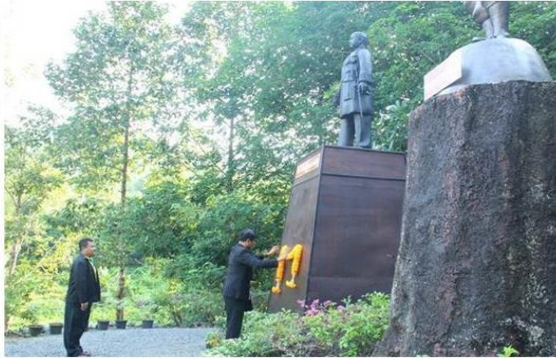
กรุงเทพฯ--10 เม.ย.--การยางแห่งประเทศไทย

ข่าวประชาสัมพันธ์ทั่วไป Tuesday April 10, 2018 12:10