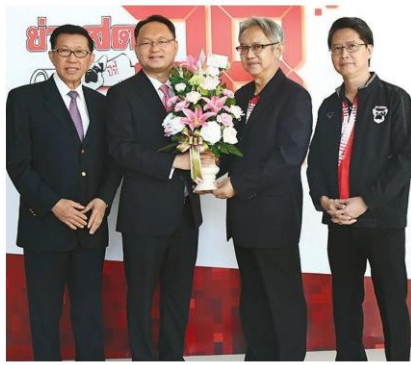
ยุทธพงศ์ จรัสเสถียร อธิการฯ มทร.ธบุรี