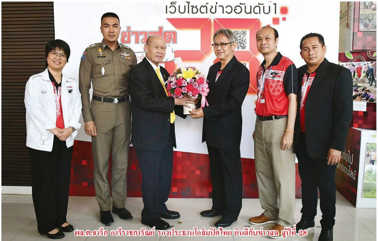
พล.ต.จาริก อารีราชการัญญ์ รองประธานโอลิมปิกไทย ยินดีกับข่าวสด สู่ปีที่-28