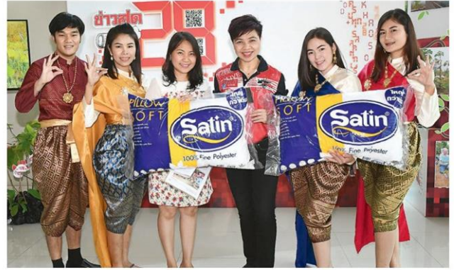
ทีมทีอาร์เครื่องนอน 'ชาติน' จัดเต็มคอสตูม