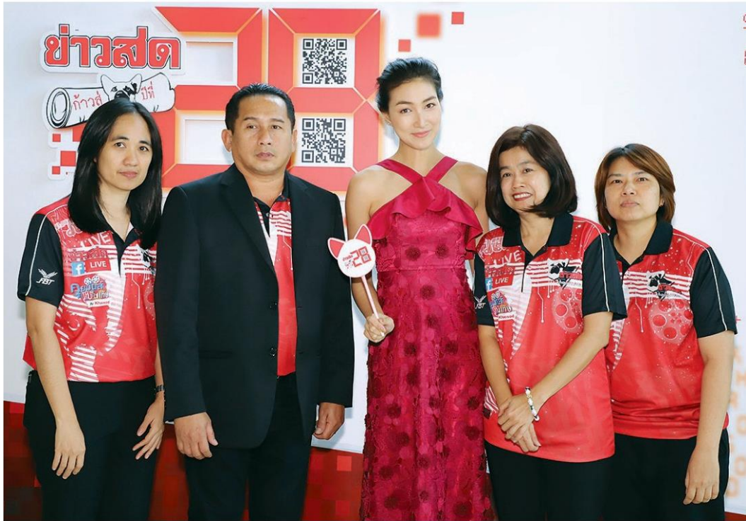
'แพนเค้ก' สวยแซ่บแดงเจิดจ้า ในนามทรูไรรู้

หัวข้อข่าว: 'อ้อเจ้า'ร่วม'ข่าวสด'ชมวัดสมทบทุนในโอกาสก้าวสู่ปี28ทุกวงการร่วมยินดี