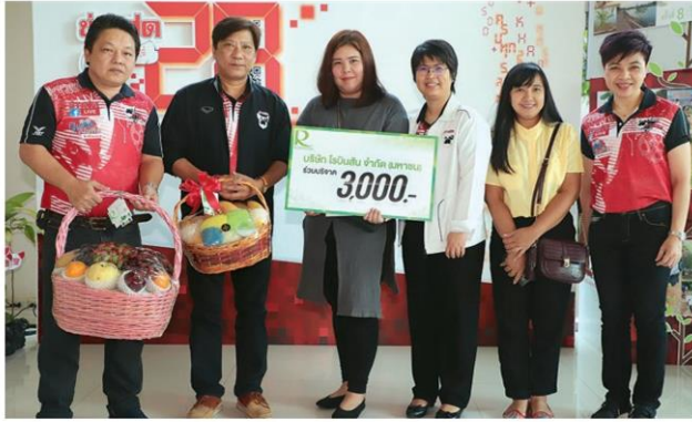
'โรบินสัน' ส่งสาว ๆ ร่วมบุญร่วมฉลอง

หัวข้อข่าว: 'อจเจ้'ร่วม'ข่าวสด'ช่อมวัดสมทบทุนในโอกาสก้าวสู่ปี28ทุกวงการร่วมมือกันดี