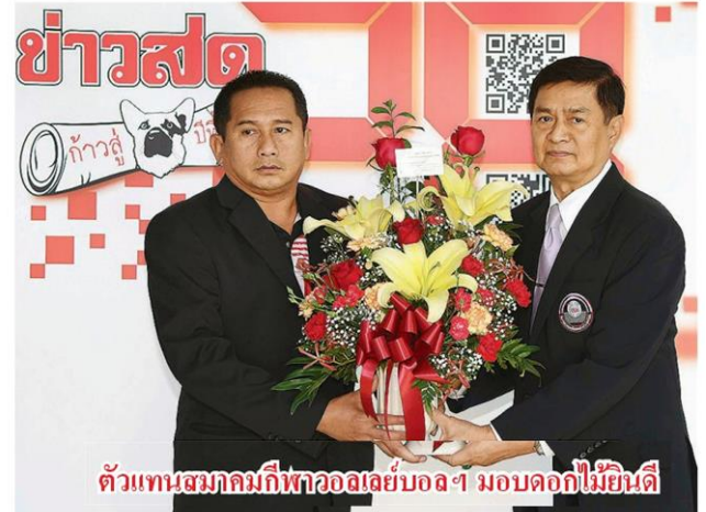
ตัวแทนสมาคมกีฬาออลเจ้บอดฯ มอบดอกไม้ยินดี