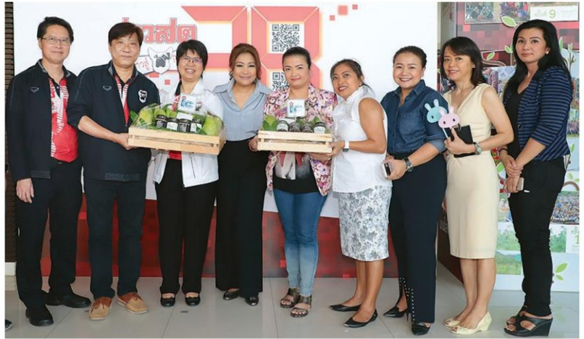
'ไอ.ซี.จี' ยกทีมทีอาร์อวยพรวันเกิดข่าวสด