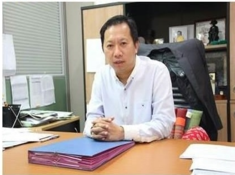
ศุภพิงห์หมด

ข่าวทั่วไป ThaiPR.net -- อังคารที่ 10 เมษายน 2561 09:09:19 น.