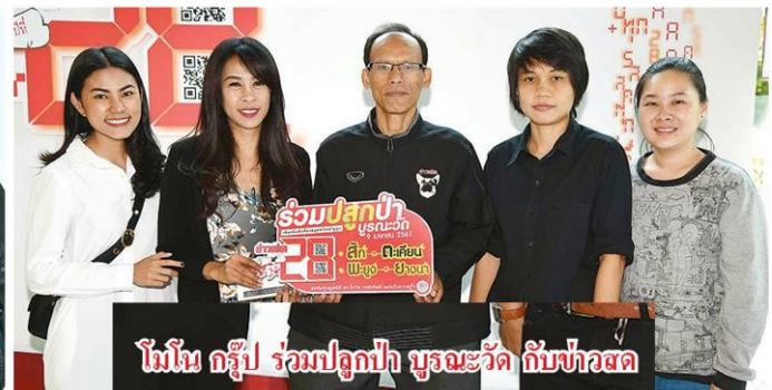
โมนัน กรู๊ป ร่วมปลูกป่า บูรณะวัด กับข่าวสด