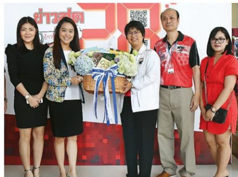
กิ่งเพชร ออร์ส่งสาว ๆ อวยพร