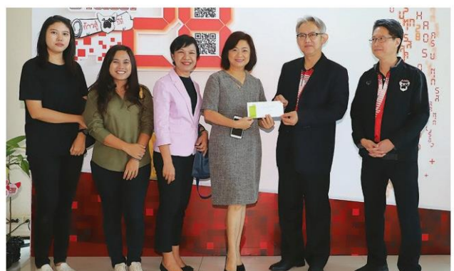
'ทีนภ-นิรมล' นำทีมป่าใหญ่ทำบุญปลูกป่า