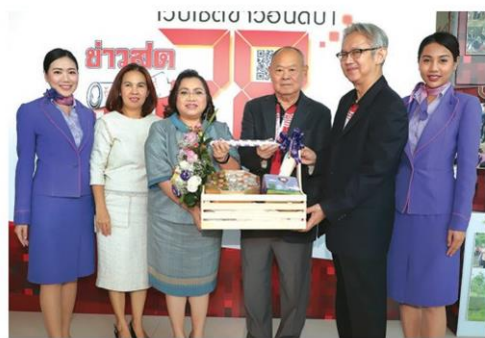
'บินไทย' หอมของจรรยาธรรม์อึ้งหลวง