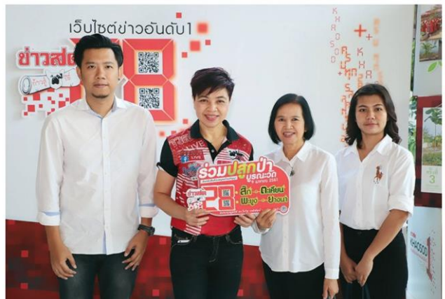
'สวนสยาม' อิมมูญูอิมสุขกับทุกครั้ง