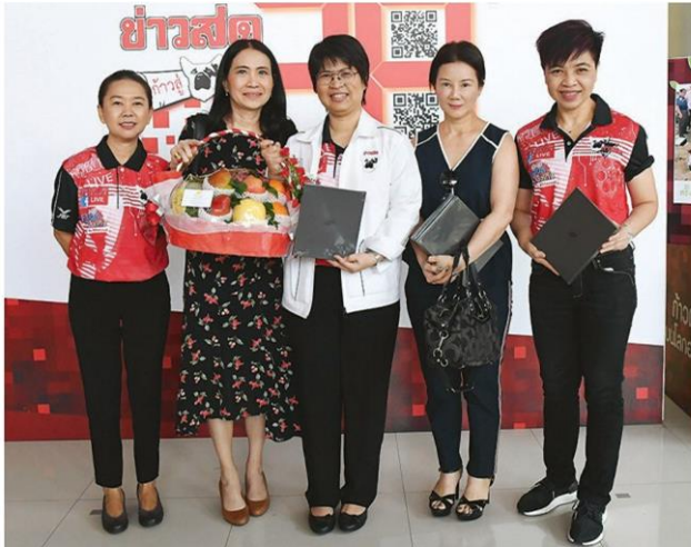
'แมกโนเลียส์' มาฉลองทุกปี