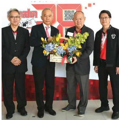
สุวัจน์ ลิปตพัลลภ อธิการบดี