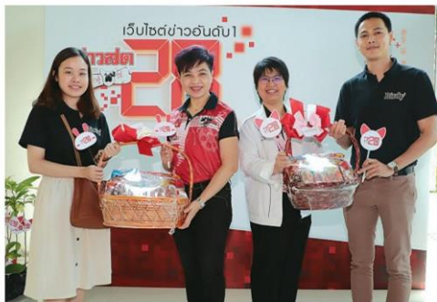
'อัยโนะโมะโตะ' มอบของดีเติมพลัง