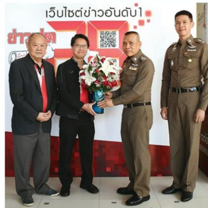
พล.ต.อ.เฉลิมเกียรติ ศรีวรขาน รอง ผบ.ตร.