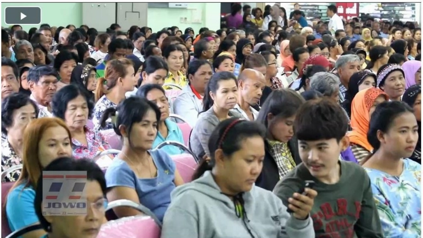
สกก.ประเหลียน เอ ทำMOUพัฒนาคุณภาพยางส่งเสริมการปลูกพืชผสมผสาน