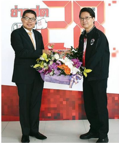
ทวีศักดิ์ เลิศประพันธ์ รองผู้ว่าฯกทม.