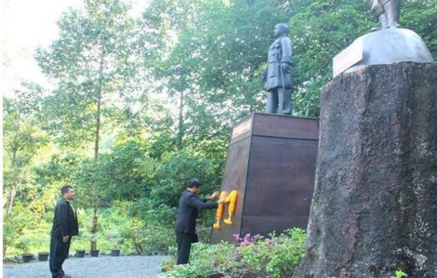
กรุงเทพฯ--10 เม.ย.--การยางแห่งประเทศไทย

วันที่ 10 (เม.ย. 61) การยางแห่งประเทศไทย จัดงานวันยางพาราแห่งชาติ ปี 2561 น้อมรำลึก 2 บิดาแห่งยางพาราไทย ร่วมสักการะและบวงสรวงอนุสาวรีย์พระยาสุรินทรภักดีศรีณรงค์ และอนุสาวรีย์หลวงราชโนนศรี พร้อมชมนิทรรศการชีวประวัติเพื่อรำลึกคุณูปการ ณ อนุสาวรีย์หลวงราชโนนศรี ต.พลับ อ.เมือง จ.จันทบุรี