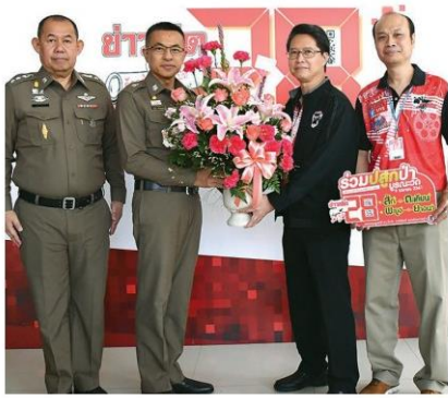
พล.ต.ท.สุวัฒน์ แจ้งยอดสุข ผบช.ภาค 1