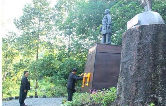
กรุงเทพฯ--10 เม.ย.--การยางแห่งประเทศไทย

วันที่ (10 เม.ย. 61) การยางแห่งประเทศไทย จัดงานวันยางพาราแห่งชาติ ปี 2561 น้อมรำลึก 2 บิดาแห่งยางพาราไทย ร่วมสักการะและบวงสรวงอนุสาวรีย์พระยาสุรินทภักดีศรีณรงค์ และอนุสาวรีย์หลวงราชไมตรี พร้อมชมนิทรรศการชีวประวัติเพื่อรำลึกคุณูปการ ณ อนุสาวรีย์หลวงราชไมตรี ต.พลับ อ.เมือง จ.จันทบุรี