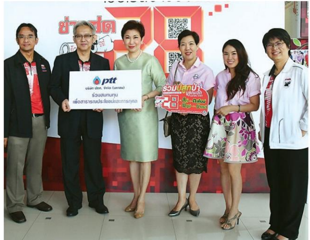
ปตท.ระดมทีมที่อาร์ดองข่าวสดสู่ปี 28