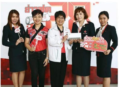
'สภากาชาดไทย' ร่วมปลูกป่าบูรณะวัด