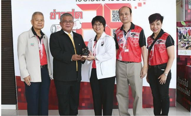
'วิริยะประกันภัย' ร่วมออกซุ้มอาหาร

หัวข้อข่าว: 'ออเจ้า'ร่วม'ข่าวสด'ชอมวัดสมทบทุนในโอกาสก้าวสู่ปี28ทุกวงการร่วมยินดี