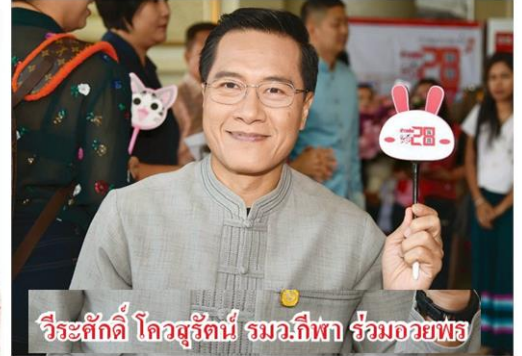
วีระศักดิ์ ไคสุรัตน์ รมว.กีฬา ร่วมอวยพร