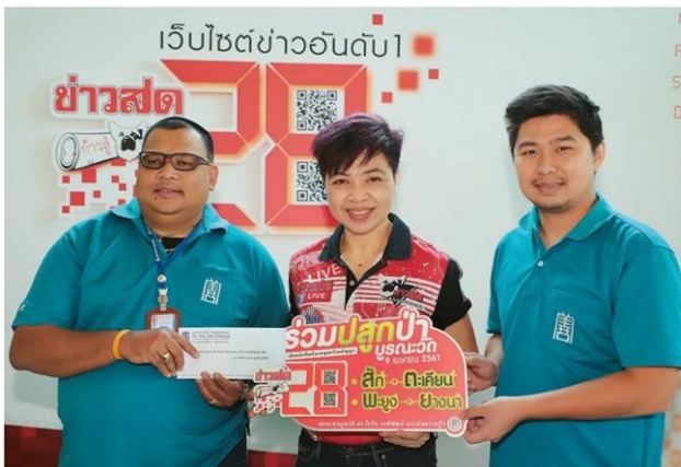
'ป๊อเต็กคิง' ส่งหนุ่มหล่อร่วมบุญปลูกป่า