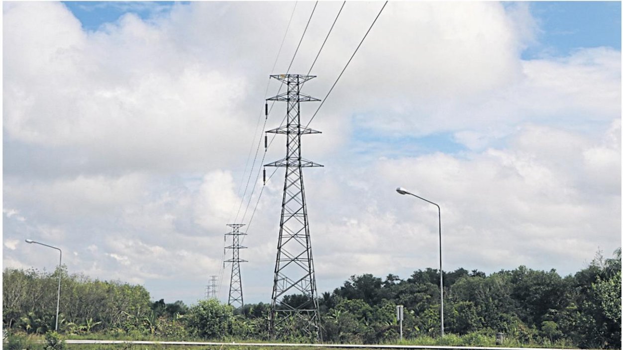
Electricity poles laid along a road in Narathiwat's Muang district. WAEDA OH HARAI