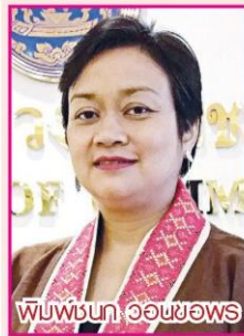
พิมพ์ชนก วอนขอพร

“สนค. จะมีการประเมินและปรับประมาณการการส่งออกอีกครั้งหลังได้ตัวเลข