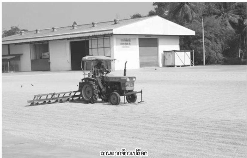
ลานตากข้าวเปลือก

ขอมา ว่าสิ่งก่อสร้างแบบไหน ครุภัณฑ์แบบไหนที่จำเป็นต้องใช้ เช่น รถโฟลคลิฟต์ รถตัก แม้ว่าจะสามารถยกของได้ในปริมาณ 2 ตันเท่ากัน แต่อาจจะราคาต่างกัน เนื่องจากคุณสมบัติและสมรรถนะในการใช้งานของรถไม่เท่ากัน เช่น สามารถยกได้สูงกว่าและ