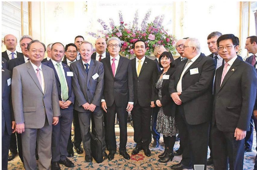
พบนักธุรกิจ - พล.อ.ประยุทธ์ จันทร์โอชา นายกรัฐมนตรีและหัวหน้าคณะรักษาความสงบแห่งชาติ พร้อมคณะ พบปะกับผู้นำการเมืองและนักธุรกิจ สหราชอาณาจักร 11 คน หลังเปิดงาน "Transforming Thailand" ที่โรงแรมเดอะแลนด์มาร์ค กรุงลอนดอน สหราชอาณาจักร เมื่อวันที่ 21 มิถุนายน

“มั่นใจว่าปีนี้การส่งออกได้ตามเป้า 8% อย่างแน่นอน เนื่องจากค่าเงินบาทเริ่มอ่อนค่าลง ทำให้มีรายได้ในรูปเงินบาทมากขึ้น รวมทั้งราคาน้ำมัน ส่งผลให้มูลค่าการส่งออกที่เกี่ยวกับผลิตภัณฑ์น้ำมันดี ซึ่งจะมีการ