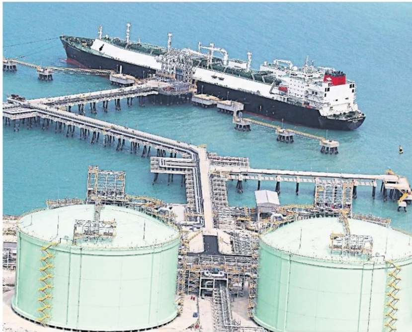
PTT's LNG terminal at Map Ta Phut Industrial Estate in Rayong province.

Biomass power plants using waste from sugar millers were the auction winners.