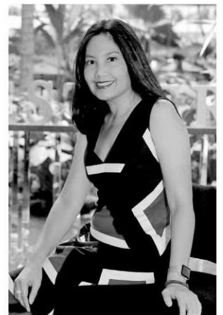
อินทุกานต์ ลิริสันต์

ที่ไม่ถูกต้องตามหลักสรีระ จะทำให้เกิดความตึงเครียดสะสมของกล้ามเนื้อ และส่งผลให้มีปัญหาเรื่องคอ บ่า ไหล่ ในที่สุด