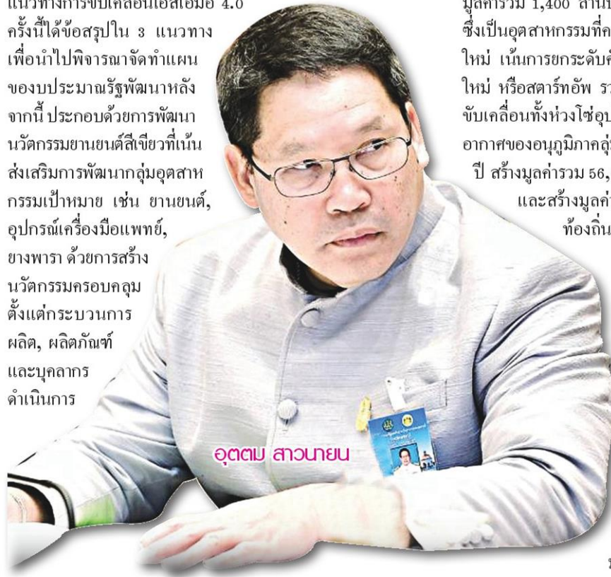
อุตตม สาวนายน

สำหรับการรับฟังความเห็นจากตัวแทนภาคเอกชนในพื้นที่ถึงแนวทางการขับเคลื่อนเอสเอ็มอี 4.0 ครั้งนี้ได้ข้อสรุปใน 3 แนวทางเพื่อนำไปพิจารณาจัดทำแผนของบประมาณรัฐพัฒนาหลังจากนี้ ประกอบด้วยการพัฒนานวัตกรรมยานยนต์สี่ล้อที่เน้นส่งเสริมการพัฒนากลุ่มอุตสาหกรรมเป้าหมาย เช่น ยานยนต์, อุปกรณ์เครื่องมือแพทย์, ยางพารา ด้วยการสร้างนวัตกรรมครอบคลุมตั้งแต่กระบวนการผลิต, ผลิตภัณฑ์ และบุคลากรดำเนินการ