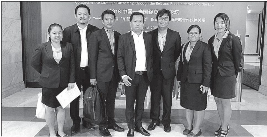
จีนซื้อยาง: องค์กรธุรกิจที่รองผู้ว่าการการยางแห่งประเทศไทย (กยท.) ด้านอุตสาหกรรมยางและการผลิตยาง พร้อมด้วยหน่วยธุรกิจ (BU) ได้เข้าร่วมเจรจาการค้า จับคู่ธุรกิจกับคู่ค้าจีน ภายใต้โครงการผลักดันการค้าระหว่างประเทศกับพันธมิตรในตลาดจีน ณ โรงแรม Bangkok Marriott Marquis Queen's Park สุขุมวิท กรุงเทพฯ เมื่อเร็วๆ นี้.