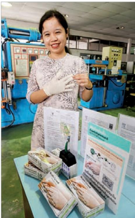
ถุงมือเคลือบสารนาโนจากสมุนไพร