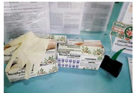
ถุงมือยางเคลือบสารอนุภาคซิลเวอร์นาโนจากธรรมชาติ