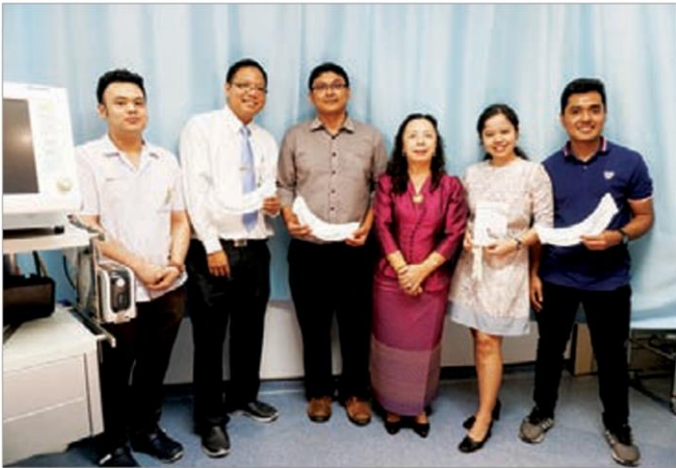
ทีมวิจัย

คอลัมน์: SCIENCE: ท่อช่วยหายใจ-ถุงมือยางลดการติดเชื้อดีอย่างไร จากสารเคลือบธรรมชาติ