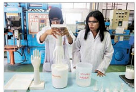
จุ่มถุงมือยาง