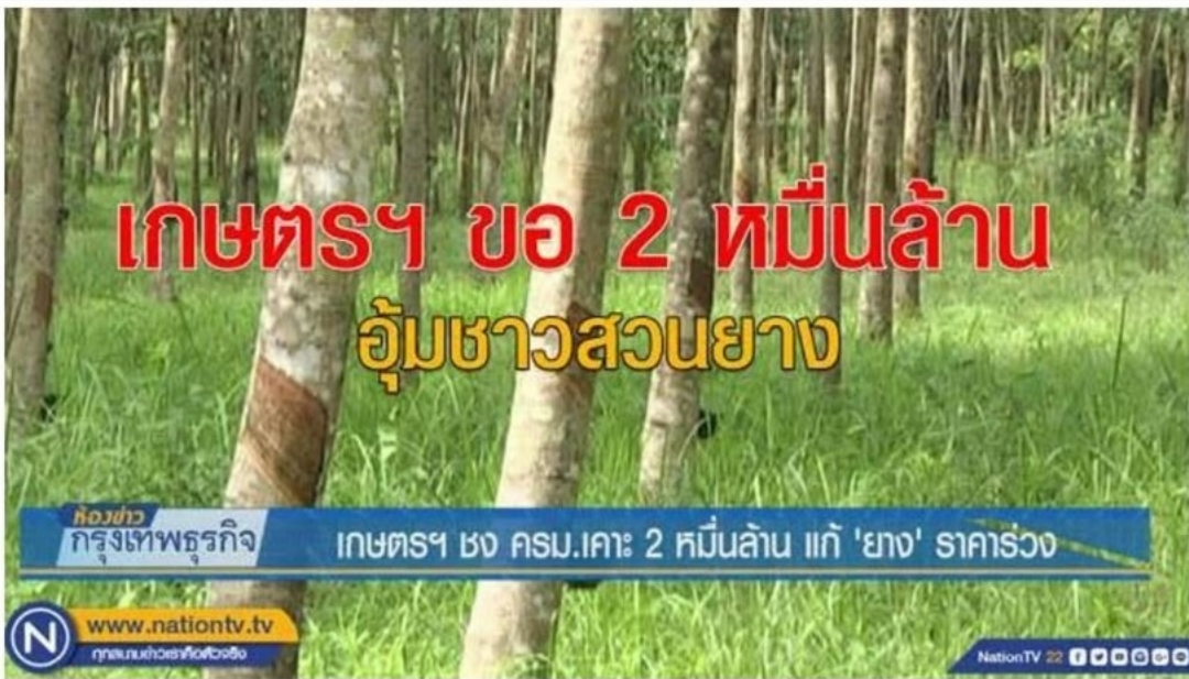
เกษตรฯ ชงกรม.เคาะ 2 หมื่นล้าน แก่ ย่าง' ราคาร่วง

หมวดหมู่ : ทั่วไป วันที่ : 15 พฤศจิกายน 2561 เข้าดู : 22 ครั้ง Share 0