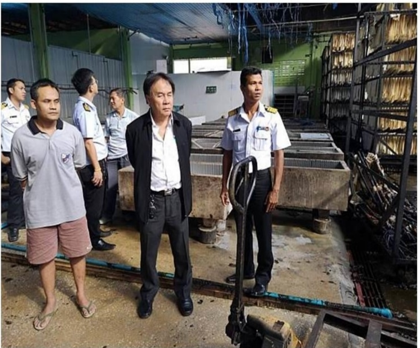
ผู้อำนวยการยางแห่งประเทศไทยสาขาจังหวัดตรัง ลงพื้นที่ติดตามเหตุการณ์เพลิงไหม้ ณ โรงรมยาง สหกรณ์กองทุนสวนยางบ้านโคกแก้ว จำกัด

หมวดหมู่ : ทวีป วันที่ : 15 มกราคม 2562 เข้าดู : 23 ครั้ง แชร์ 0