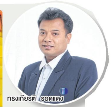
ทรงเกียรติ รอดแดง