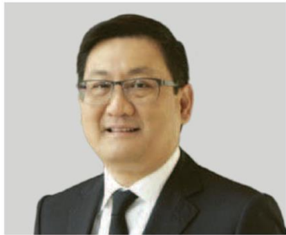
ภากร ปีตธวัชชัย

นายภากร ปีตธวัชชัย กรรมการและผู้จัดการ ตลาดหลักทรัพย์แห่งประเทศไทย (ตลท.) เปิดเผยว่า ตลท.สนใจใช้พื้นที่ Fee Trade Zone ในโครงการพัฒนาระเบียงเศรษฐกิจพิเศษภาคตะวันออก (อีอีซี) ทำธุรกิจใหม่ๆ ในอนาคตซึ่งขณะนี้ อยู่ระหว่างศึกษาความเป็นไปได้ในการเปิดซื้อขาย และจุดส่งมอบสินค้าโภคภัณฑ์ เช่น ยาง ทองคำ ข้าว น้ำตาล และมันสำปะหลัง จากที่โครงการอีอีซี นั้นมีการพัฒนาการขนส่ง ทั้งทางบก อากาศ น้ำ และระบบราง ทำให้มีศักยภาพในการส่งออกสินค้า และการสร้างคลังสินค้าโภคภัณฑ์