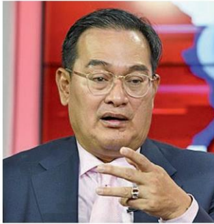
นิกร จ้าง

คอลัมน์: มติชนเลือกตั้ง: พรรคขนาดกลาง ไชววิชั่น'ปรองดอง'สู่เลือกตั้ง?