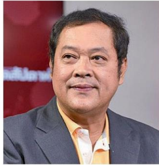
พ.ต.ท.วี สอดส่อง