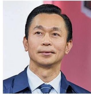
พ.ต.อ.รอมนกร ทับทิมธงไชย

รักษาพยาบาลและสวัสดิการเท่าเดิมทุกประการจะแก้ปัญหาหยาบกระด้าง จนกระจาย เป็นการเติมเงินเข้าไปในกระเปาะ