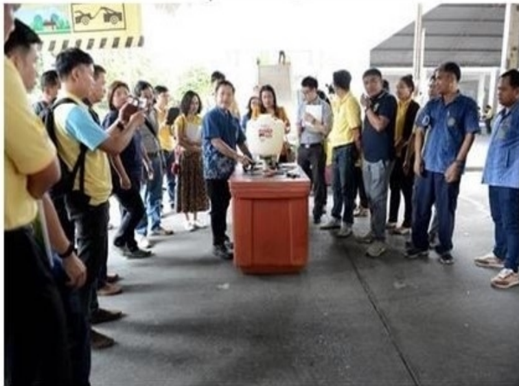
ดูรูปทั้งหมด

กรุงเทพฯ--10 พ.ค.--กรมวิชาการเกษตร เพื่อเกษตรกร