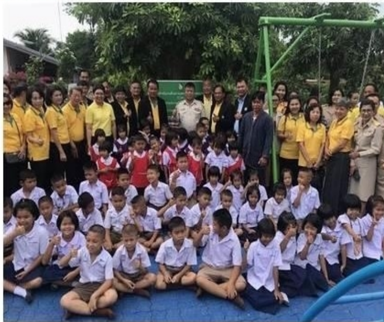
ดูรูปทั้งหมด

ข่าวทั่วไป ThaiPR.net -- จันทร์ที่ 1 กรกฎาคม 2562 13:38:25 น.