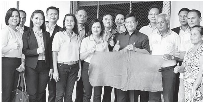
เยี่ยมชม อลงกรณ์ พลบุตร ที่ปรึกษา รว.เกษตรและสหกรณ์ นำคณะทูตเกษตรประจำประเทศต่างๆ ร่วมกิจกรรม “พาณิชย์สัญจร” เยี่ยมชมกองทุนสวนยางบ้านหุแระ จำกัด อ.หาดใหญ่ จ.สงขลา ชมการผลิตยางแผ่นรมควัน และพบปะเกษตรกรเพื่อติดตามยกระดับคุณภาพชีวิตของเกษตรกรให้ดียิ่งขึ้น.

หัวข้อข่าว: คณะทูตเกษตรเยี่ยมชมกองทุนสวนยาง