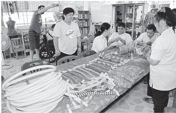
ยางยืดชีวิต กลุ่มผู้บกพร่องทางจิต อ.บางระกำ ใช้เวลาว่างจากงานประจำ ในศูนย์บริการคนพิการ ช่วยกันทำผลิตภัณฑ์ยางยืดชีวิตสำหรับใช้ในการออกกำลังกายจำหน่าย เพื่อหารายได้เสริมและแบ่งกำไรส่วนหนึ่งเข้ากองทุนไปช่วยการกุศลต่างๆ รวมทั้งผู้ประสบภัยในพื้นที่ จ.พิษณุโลก.

มาอุดหนุนซื้อไปกันจำนวนมาก มือเดออร์เข้ามาเรื่อยๆ รายได้หลังหักทุนผู้บกพร่องทางจิตที่ร่วมผลิตปกติจะมีเงินเดือนกันอยู่แล้ว แต่จะได้ค่าแรงเพิ่มจากการทำยางยืดคนละ 5 บาทต่อเส้น โดยน้องๆผู้บกพร่องทางจิตยังหักรายได้ส่วนหนึ่งเข้ากองทุนไว้เพื่อนำไปช่วยเหลือสังคมอีกด้วย ไม่ว่าจะเป็นคนพิการที่ยังไม่ได้รับบัตรคนพิการจากภาครัฐหรือผู้ประสบอัคคีภัย อุทกภัย ทางชมรมเพื่อผู้บกพร่องทางจิต จ.พิษณุโลก ก็จะออกไปช่วยเหลือกันมา โดยตลอด สำหรับผู้ที่สนใจติดต่อที่ 08-9567-4914 และ 06-1348-5613.