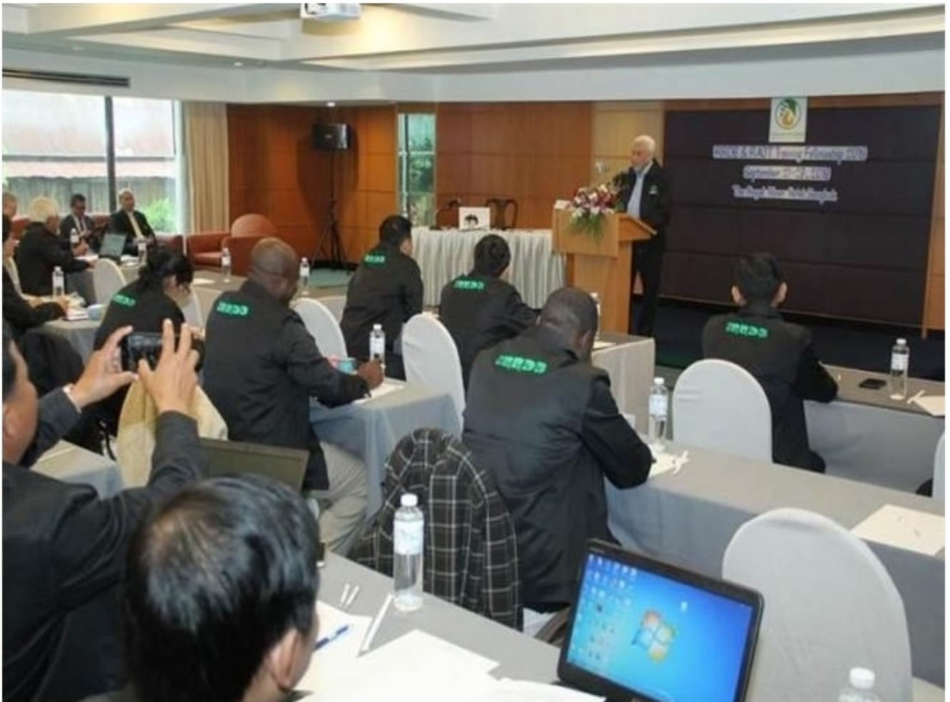
กยท. เปิดอบรม IRRDB Training Fellowship 2019 เสริมความรู้ให้นักเรียนทุน 21 ประเทศ เน้นการแปรรูปอุตสาหกรรมยาง