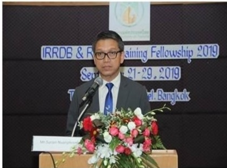
ดูรูปทั้งหมด

ข่าวทั่วไป ThaiPR.net -- จันทร์ที่ 23 กันยายน 2562 14:02:56 u.