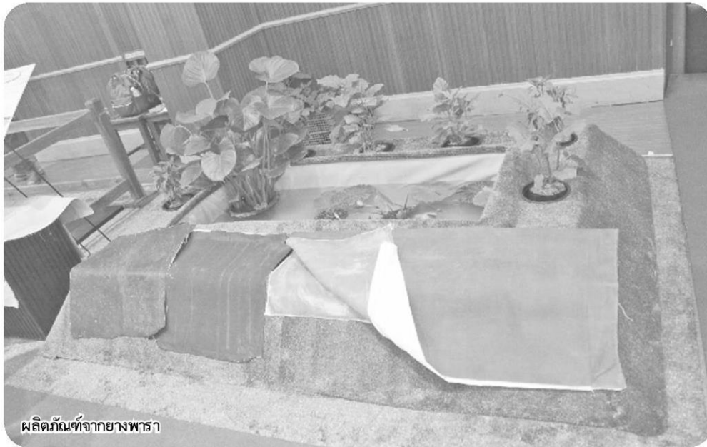
ผลิตภัณฑ์จากยางพารา