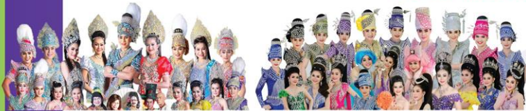
ประตมบันเทิงศิลป์ 17 ธ.ค.