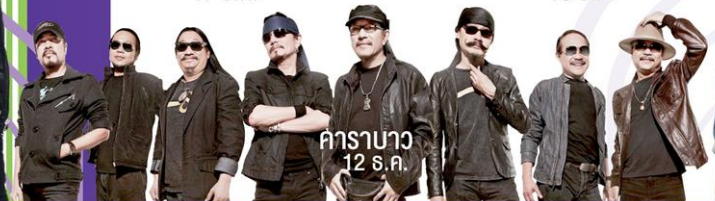
คาราบาว 12 ธ.ค.