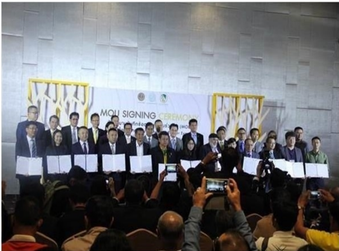
กรุงเทพฯ--2 ธ.ค.--การยางแห่งประเทศไทย