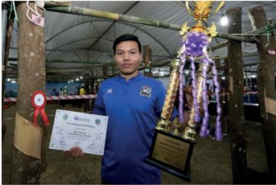
แชมป์กรีดยาง

นอกจากนี้ มีกิจกรรมบูรณาการด้านการส่งเสริมความรู้ การฝึกทักษะ การแข่งขัน อาทิ บึงกาฬลานเด็กเล่น การแข่งขันลับมีด