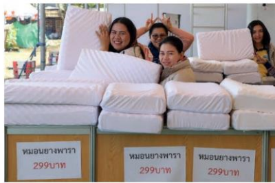
หมอนยางพาราราคาพิเศษ

การนำน้ำยางมาแปรรูปให้เกิดการค้าการลงทุนในพื้นที่ และมีกรมเซ็นเอ็มโอยูชื้อขายหมอน และที่นอนยางพารา การร่วมลงนามในบันทึกข้อตกลงความร่วมมือ (เอ็มโอยู) ในการรับซื้อขายยางพาราก้อนถ้วยของเกษตรกรชาวบึงกาฬ โดยมีนายจรินทร์ ลักษณวิศิษฏ์ รองนายกรัฐมนตรี และรัฐมนตรีว่าการกระทรวงพาณิชย์ นายพินิจ