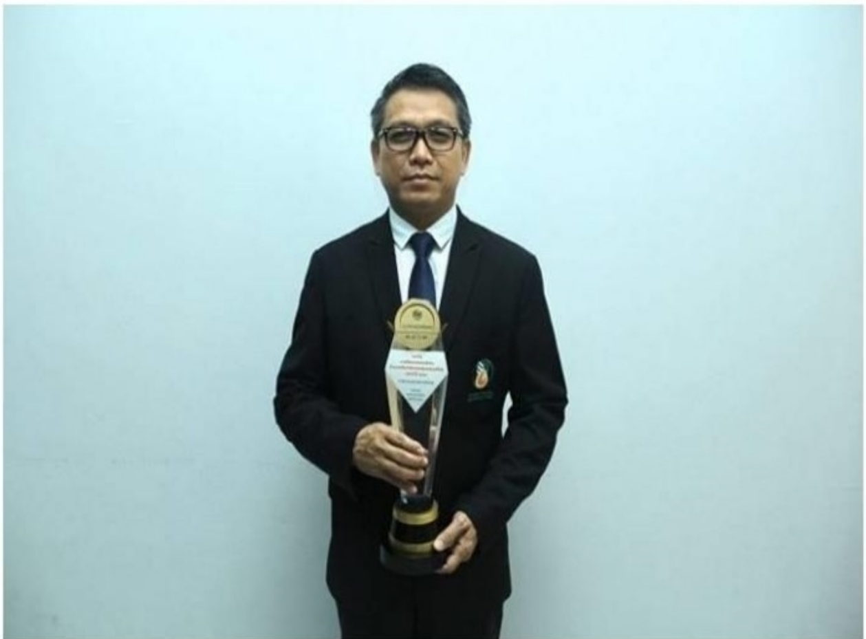
เผยแพร่ วันพฤหัสบดีที่ 26 ธันวาคม พ.ศ.2562