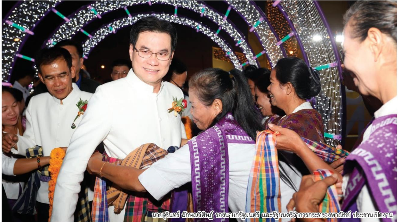
นายจรินทร์ ลักษณวิศิษฏ์ รองนายกรัฐมนตรี และรัฐมนตรีว่าการกระทรวงพาณิชย์ ประธานเปิดงาน

หัวข้อข่าว: "วันยางพารา 2563 : บึงกาฬโมเดล 2020" มหกรรมยางพารายิ่งใหญ่ที่สุดในภาคอีสาน