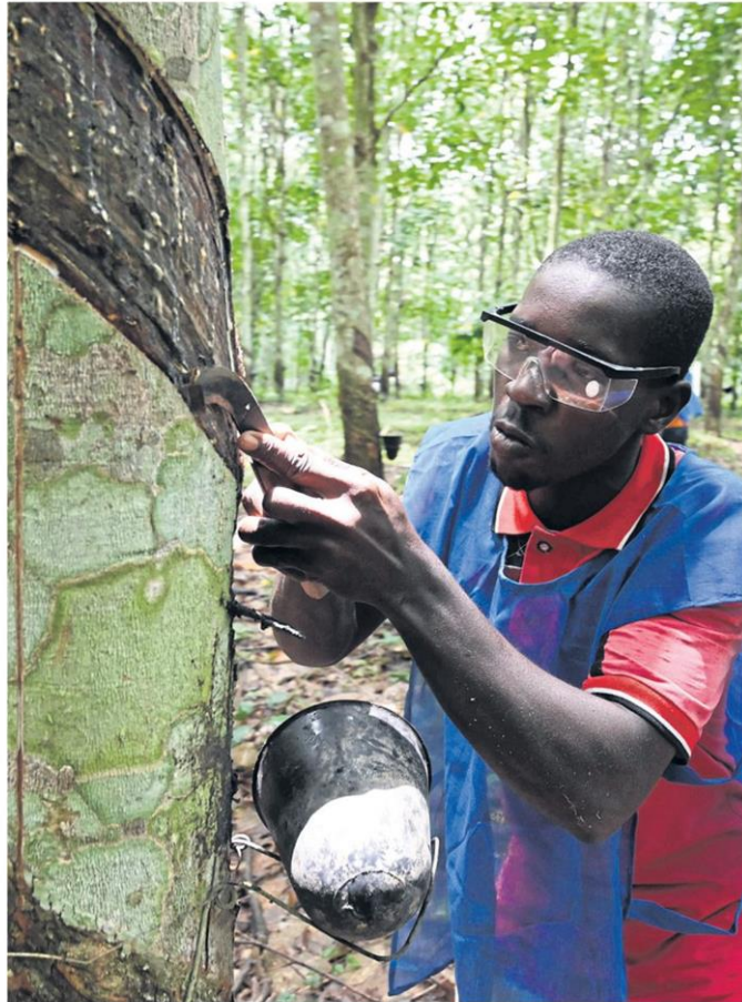
LEFT Annual Ivorian rubber production is 624,000 tonnes and some forecasts hold that it may reach one million.

Headline: Ivory Coast's planters dismiss linking rubber to deforestation