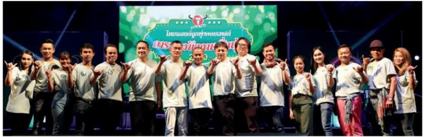
10 คนสุดท้ายเข้ารอบชิงชนะเลิศ การประกวดบึงกาฬพันธุ์

นอกจากนี้ ภายในงาน มีหน่วยงานราชการของจังหวัดได้เข้าร่วมโชว์ผลงานหลายหน่วยงาน อาทิ หอการค้าจังหวัด สำนักงานเกษตรจังหวัด สำนักงานพลังงานจังหวัด แขวงการทางจังหวัด ซึ่งช่วยเสริมสร้างความรู้และการพัฒนาจังหวัดอีกทางหนึ่งด้วย