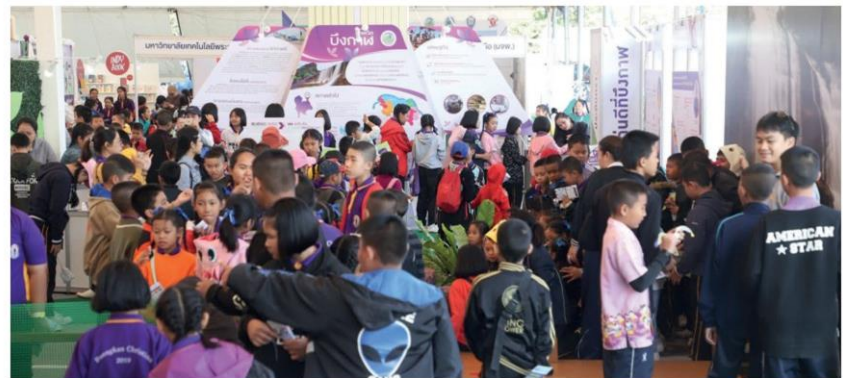
ประชาชนและเด็ก ร่วมชมงานกับศีกัก