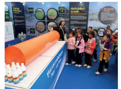
ผู้ยางพาราผักพัฒนาของกรมชลประทานได้รับความสนใจจากเด็ก ๆ