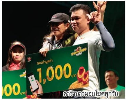
คาราบาวมอบโชคทุกวัน