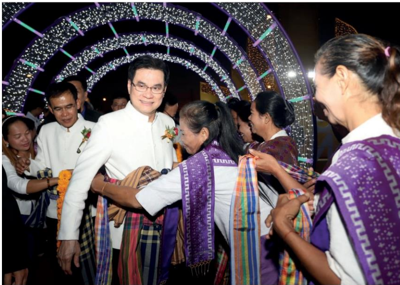
นายจรินทร์ ลักษณวิศิษฏ์ รองนายกรัฐมนตรี และรัฐมนตรีว่าการกระทรวงพาณิชย์ เป็นประธานเปิดงาน