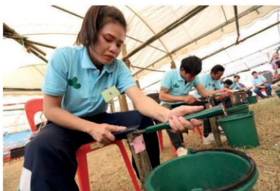
แข่งขันลับมีดกรีดยาง

ในช่วงการจัดงาน มีการเปิดโรงงานผลิตหมอนยางพารา ซึ่งถือเป็นการค้าดำเนิน