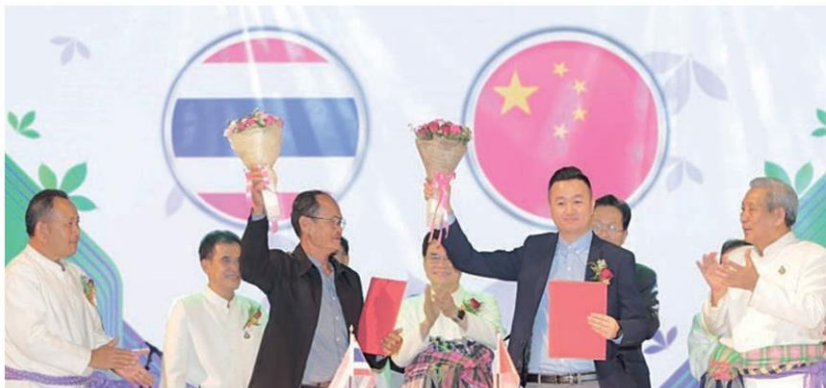
เอ็มโอยู ซีอามอนและทีมอนยางพารา

ยางพารา ถือว่าเป็นพืชที่มีความสำคัญกับจังหวัดบึงกาฬ ทั้งภาคอุตสาหกรรม เกษตรกรรม ที่เชื่อมโยงสู่การพัฒนาในด้านต่างๆ อันส่งผลต่อการเติบโตของเมืองเป็นอย่างมาก