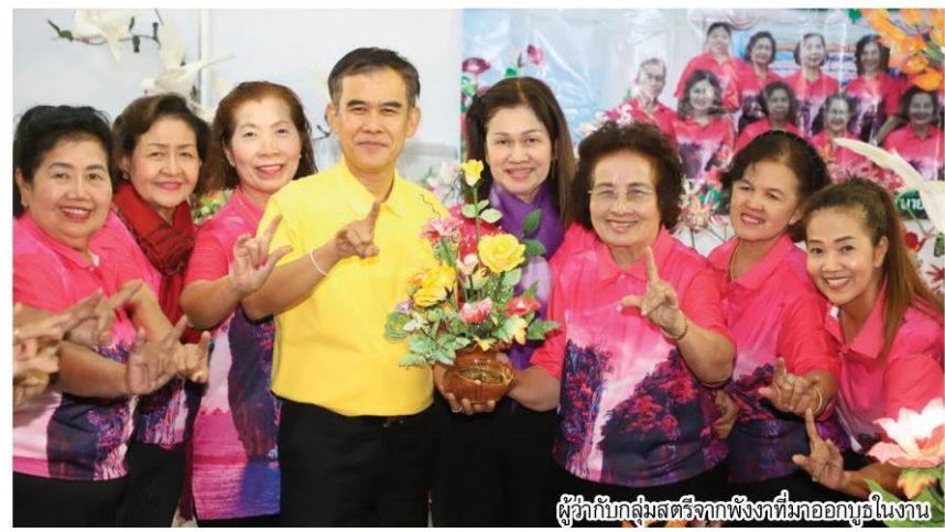
ผู้กำกับกลุ่มสตรีจากฟิงทิมกออภุขในงาน