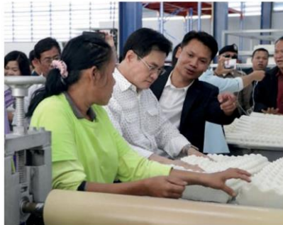
'จรินทร์' เยี่ยมชมโรงงานผลิตหมอนและที่นอน