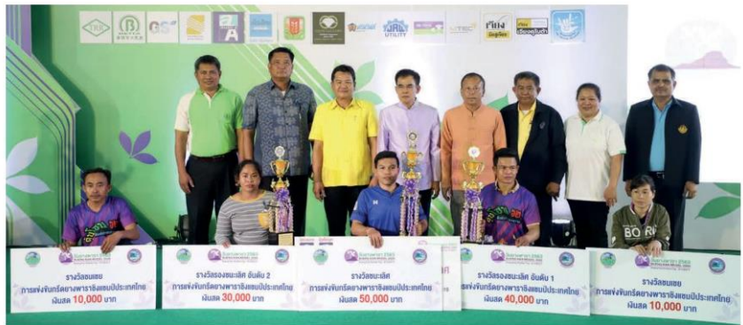
สantik ขาวสอาด ผู้นำราชการจังหวัดบึงกาฬ ให้เกียรติเป็นประธาน มอบรางวัลในการแข่งขันกิจกรรมยางพารา