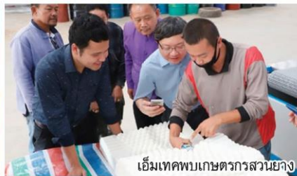
เอ็มเทคพบเกษตรกรสวนยาง

แขกสำคัญร่วมในพิธีเป็นจำนวนมาก ถือว่าเป็นพิธีเปิดที่ยิ่งใหญ่ อลังการ โดยสรุปแล้วการจัดงานในครั้งนี้ประสบความสำเร็จอย่างดียิ่ง ไม่พบปัญหาหรืออุปสรรค ส่วนในปีต่อไปจะมีการเพิ่มเติม โดยการเชิญต่างประเทศที่มีกิจกรรมเกี่ยวกับการทำยางพารามาร่วมออกบูธ และแลกเปลี่ยนองค์ความรู้ นวัตกรรมต่างๆ เพื่อประโยชน์กับพี่น้องประชาชนชาวบึงกาฬ"