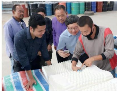
เอ็มเค สรรวจการใช้นวัตกรรมในโรงงานหมอนของชุมชนสหกรณ์