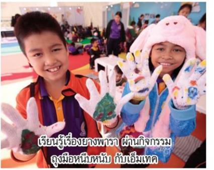
เรียนรู้เรื่องยางพารา ผ่านกิจกรรมถุงมือหมีหนึบ กับเอ็มเทค