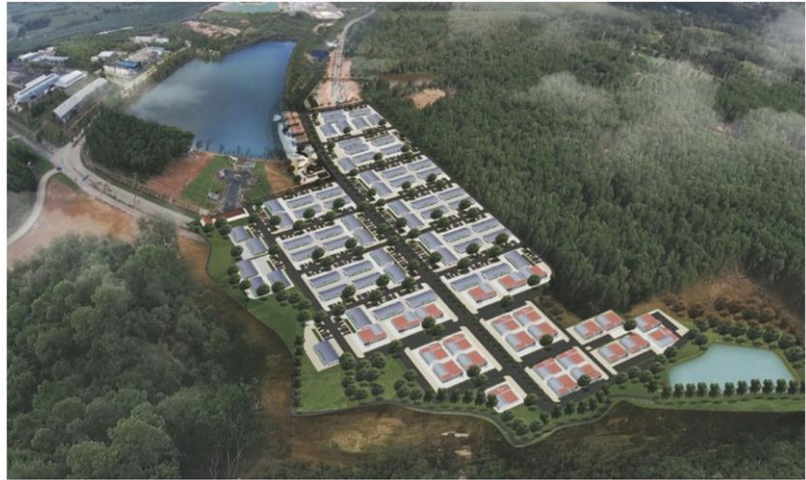
นิคมอ่วม - นิคมอุตสาหกรรมยางพารา จ.สงขลา บนพื้นที่ 1,218 ไร่ ก่อสร้างเสร็จแล้ว เตรียมปรับขึ้นค่าเช่า-ค่าซื้อที่ดิน อีก 10% ในวันที่ 1 ก.ค. 63

ซึ่งโครงการนิคมอุตสาหกรรมยางพารา (Rubber City) ตั้งอยู่ในพื้นที่ระยะที่ 2/2 และ 3 ของนิคมอุตสาหกรรมภาคใต้ อยู่