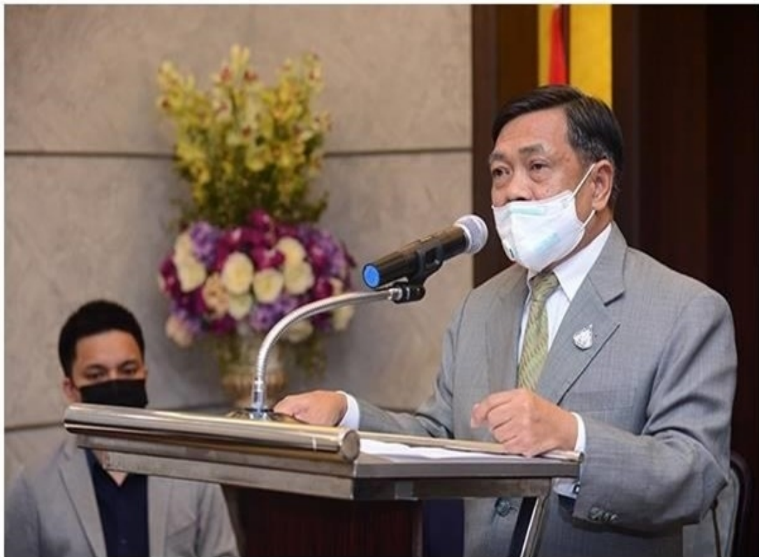
ชาวสวนยางขอบคุณรัฐบาลและกระทรวงเกษตรและสหกรณ์ ช่วยเหลือผ่านโครงการประกันรายได้และเยียวยาเกษตรกร กว่า 8 หมื่นล้านบาท

ทั้งนี้ คณะรัฐมนตรีมีมติเมื่อวันที่ 16 มิถุนายน 2563 ได้อนุมัติกลุ่มเป้าหมายเพิ่มเติมคือ กลุ่มเกษตรกรที่ด้อยโอกาส และยังไม่สามารถเข้าถึงโครงสร้างพื้นฐานด้านเกษตรกรจำนวน 137,093 ราย ซึ่งเป็นเกษตรกรชาวสวนยางที่ไม่มีเอกสารสิทธิ์ที่มีทะเบียนกับการยางแห่งประเทศไทย 66,960 ราย และเกษตรกรที่ไม่มีเอกสารสิทธิ์ที่ลงทะเบียนกับกรมส่งเสริมการเกษตรอีก 70,133 ราย ดังนั้น เกษตรกรชาวสวนยางที่ขึ้นทะเบียน และแจ้งข้อมูลกับการยางแห่งประเทศไทยจำนวน 1,817,723 ราย แบ่งเป็น เกษตรกรชาวสวนยางที่มีเอกสารสิทธิ์ 1,478,463 ราย และเกษตรกรชาวสวนยางที่ไม่มีเอกสารสิทธิ์ 339,260 ราย ได้รับการเยียวยาจากผลกระทบโควิด19 ในครั้งนี้ถ้วนหน้า