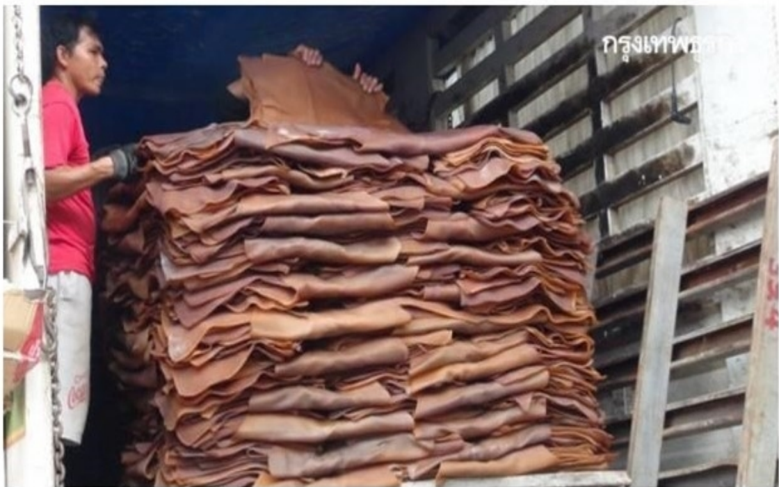
23 กรกฎาคม 2564 | โดย การยางแห่งประเทศไทย

ราคายางแผ่นรมควัน ชั้น 1 (ส.ค.) กรุงเทพฯ 59.35บาท/กก. สงขลา 59.10บาท/กก.