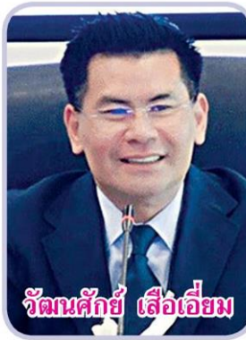
วัฒนศักดิ์ เสือเอี่ยม

นายวัฒนศักดิ์ เสือเอี่ยม อธิบดีกรมการค้าภายใน เปิดเผยว่า ขณะนี้กรมอยู่ระหว่างการจัดเตรียมโครงการประกันรายได้เกษตรกร ซึ่งจะดำเนินการต่อเนื่องเป็นปีที่ 3 โดยในส่วนที่กระทรวงพาณิชย์ รับผิดชอบ ประกอบด้วย โครงการประกันรายได้สินค้าเกษตร 4 รายการ คือ ข้าวเปลือก, ข้าวโพดเลี้ยงสัตว์, ปาล์มน้ำมัน และมันสำปะหลัง ส่วนกระทรวงเกษตรและสหกรณ์ รับผิดชอบประกันรายได้ยางพารา