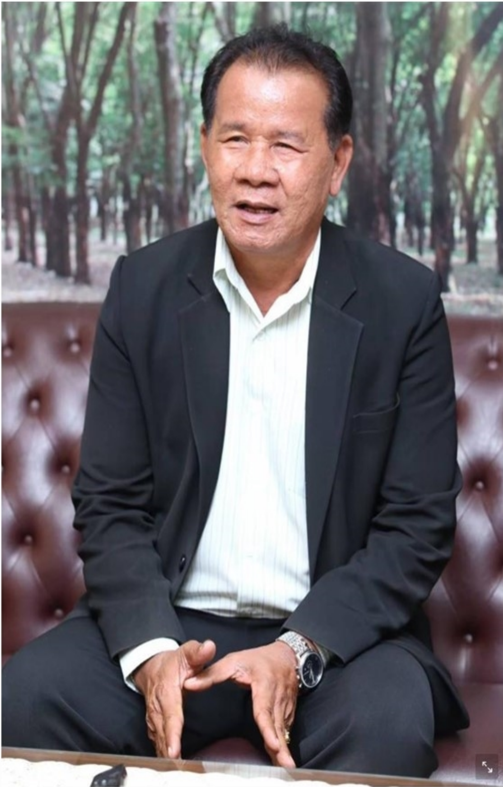
สังขเวิน ทวดห้อย

หัวข้อข่าว: 26 ส.ค. จับตา บอร์ด กยท. ยกกระต๊อบัตรสีชมพู สำเร็จหรือไม่ | ฐานเศรษฐกิจ | LINE TODAY