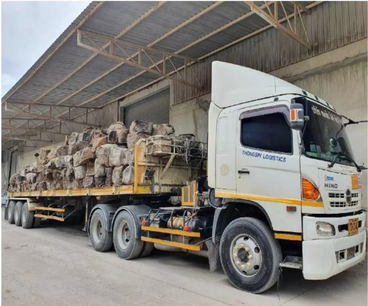
กยท.เปิดประมูล "โละสต็อกยาง" ได้มากกว่าเสีย

นอกจากนี้การเก็บรักษาภายในสต็อกยังมีค่าใช้จ่ายในเรื่องค่าเช่าโกดัง ค่าประกันภัยขางพารา โดยระหว่างปี 2555-2559 ใช้เงินไปทั้งสิ้น 2,317 ล้านบาท และระหว่างปี 2559-2564 ใช้เงินไปอีก 925 ล้านบาท เป็นการนำเงินจากกองทุนพัฒนายางพาราซึ่งเป็นเงินที่ดูแลเกษตรกรชาวสวนยางมาใช้