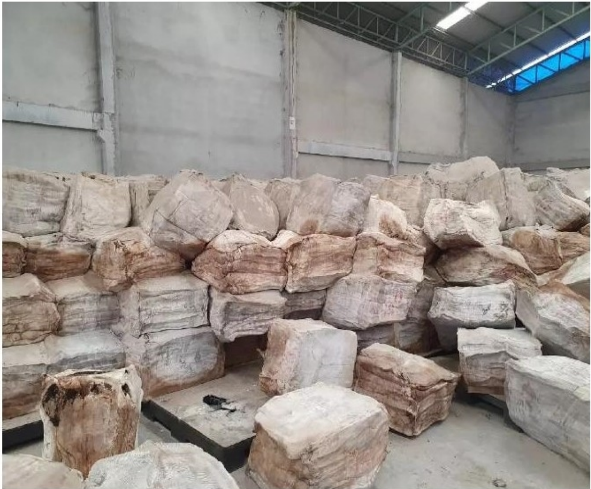
กยท.เปิดประมูล "โล๊ะสต็อกยาง" ได้มากกว่าเสีย

และนำเสนอต่อคณะรัฐมนตรี(ครม.)พิจารณาเมื่อวันที่ 3 พ.ย. 2563 ซึ่ง ครม.ก็มีมติเห็นชอบให้เร่ง "ระบายยางในสต็อก" เพื่อลดภาระงบประมาณและรักษาประโยชน์สูงสุดของรัฐ โดยต้องคู้จังหวะที่เหมาะสมและไม่กระทบกับราคา ยางในตลาดมากนัก