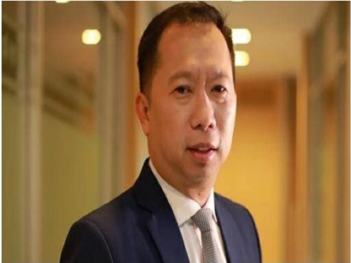
กยท.เปิดประมูล "โละสต็อกยาง" ได้มากกว่าเสีย

หัวข้อข่าว: กยท.เปิดประมูล "โละสต็อกยาง" ได้มากกว่าเสีย