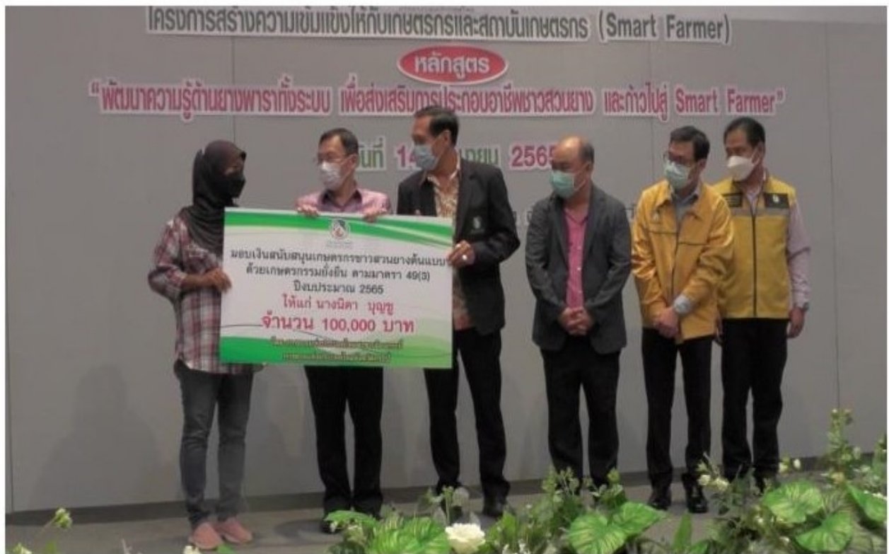
ทีมข่าวกระบี่

หัวข้อข่าว: การยางกระบี่พัฒนาความรู้เกษตรกรด้านยางพาราทั้งระบบเพื่อส่งเสริมการประกอบอาชีพชาวสวนยาง