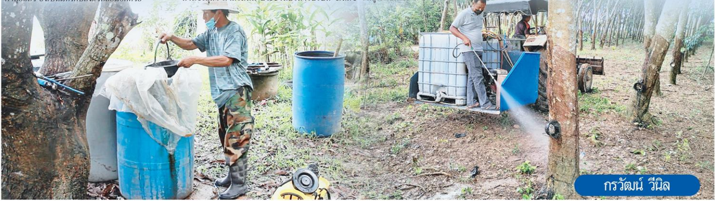
การวัฒน์ วีนิล

ทนความร้อนได้ถึง 100°C... ในดินได้... จะมีส่วนเท่ากับใช้ปุ๋ยคุณภาพสูงเกือบ 2... โดยมหาวิทยาลัยเกษตรศาสตร์... และอยู่ระหว่างทดลองฉบับปรับปรุง