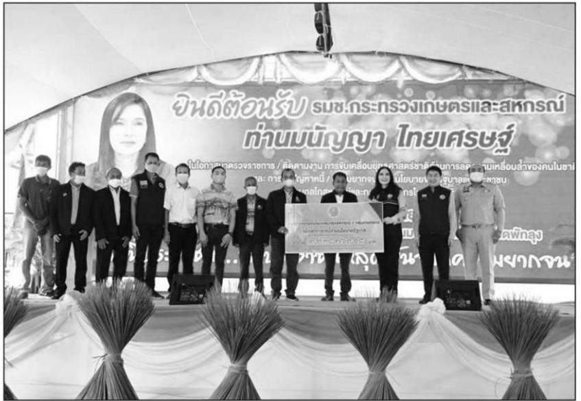
ชื่นชม : น.ส.มัญญา ไทยเศรษฐ์ รัฐมนตรีและสหกรณ์ ตรวจติดตามโครงการแก้ไขปัญหาหนี้ให้กับประชาชน ที่สหกรณ์ อ.ควนขนุน จ.พัทลุง โดยชื่นชมการแก้ปัญหาหนี้สินให้สมาชิกฯ ลดความเหลื่อมล้ำและปัญหาความยากจน ตั้งเป้าปี 2566 ให้สหกรณ์ทุกแห่งหาแนวทางลดหนี้สินให้ได้

น.ส.มัญญา กล่าว ทั้งนี้ สหกรณ์และกลุ่มเกษตรกร จ.พัทลุง ได้ขับเคลื่อนร่วมกับสมาชิก ใน 6 โครงการ โดยมีสมาชิกสหกรณ์ภาคการเกษตรใน 11 อำเภอของ จ.พัทลุง เข้าร่วมกว่า 2,420 ครัวเรือน ส่งต่อผลผลิตไปยังซูเปอร์มาร์เก็ตสหกรณ์ในพื้นที่ชุมชน