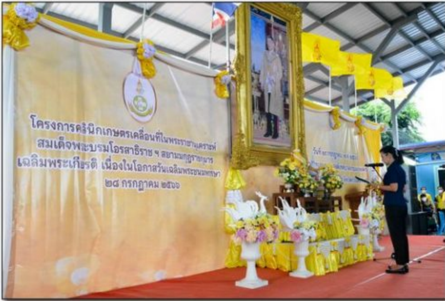
จังหวัดกำแพงเพชร จัดโครงการคลินิกเกษตรเคลื่อนที่ ในพระราชานุเคราะห์สมเด็จพระบรมโอรสาธิราชฯสยามมกุฎราชกุมาร ปังนประมาณ พ.ศ. 2566 ครั้งที่ 4