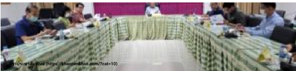
ข่าวประชาสัมพันธ์ (https://khaopenkhao.com/?cat=10)