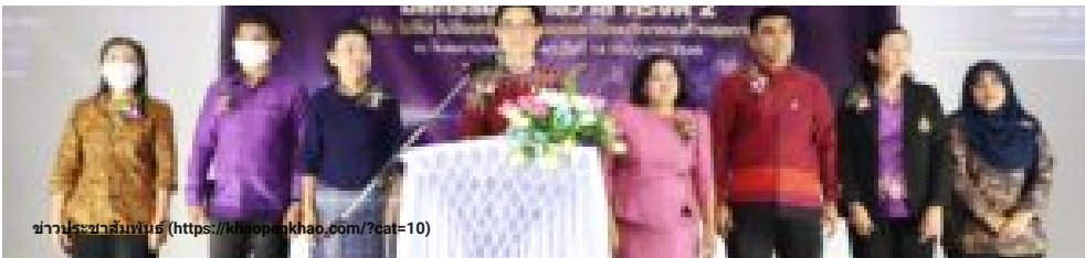
ข่าวประชาสัมพันธ์ (https://khaopenkhao.com/?cat=10)

(https://khaopenkhao.com/?p=73656) นราธิวาส จัดงานมหกรรมชราธิวาส ครั้งที่ 2 “ส่งเสริมสุขภาพผู้สูงอายุ ป้องกันหกล้ม ไม่ล้ม ไม่ซึมเศร้า กินข้าวอร่อย ด้วยนวัตกรรมด้านสุขภาพ ปี 2566” (https://khaopenkhao.com/?p=73656)